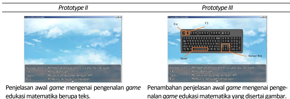
Tabel 5. Hasil revisi tahap small group

Pada akhir tahap small group peneliti melakukan tes untuk menyelidiki apakah terdapat kegagalan belajar dalam penerapan game edukasi matematika dengan menggunakan soal posttest kepada siswa. Hasil yang didapatkan dari posttest dapat dilihat pada Tabel 6 .