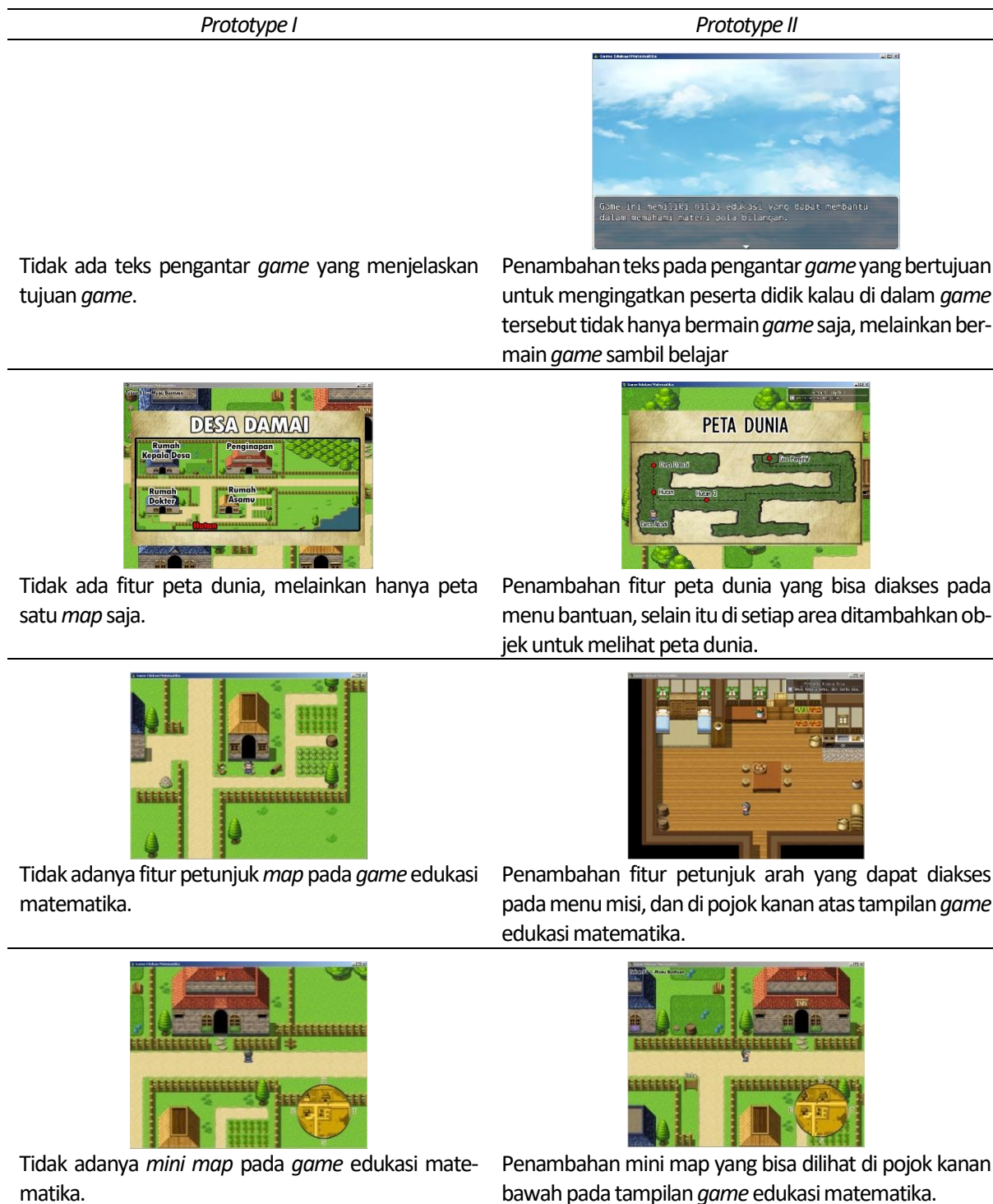
Tabel 4. Perubahan prototype I ke prototype II

Adapun komentar dari pakar yang terlibat dalam tahap expert review dalam kekurangan game edukasi matematika prototype I yaitu tidak adanya teks pengantar yang menjelaskan tujuan game yang merupakan salah satu aspek kejelasan dari suatu produk, tidak adanya menu petunjuk yang merupakan salah satu aspek kemudahan