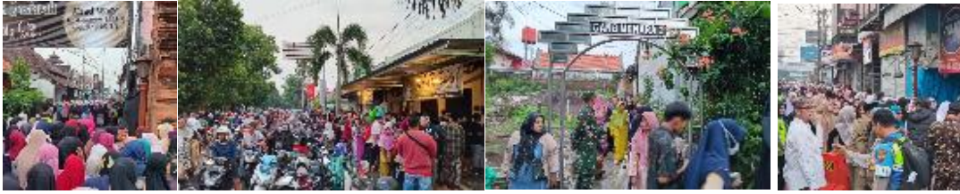
Gambar 10. Suasana Antrian Brekat Wanita sebelum memasuki Lorong pagar kilungan

Dalam penafsiran lebih lanjut, pagar kilungan juga dapat dilihat dari perspektif perubahan makna pembatas menjadi pengantar. Hal ini terjadi karena Lorong yang terbentuk diantara pagar kilungan tersebut mengantarkan orang-orang menuju hal yang baru, dari penonton menjadi pelaku/partisipan. Pada malam 10 Muharram 1447 H yang bertepatan dengan 5 Juli 2025 sesudah isya, dilaksanakan pembacaan al-Barzanji di Tajug dan Dziba' di Pawestren. Pada saat yang sama, kegiatan ziarah tetap berlangsung. Prosesi ziarah tetap melalui tajug, melewati tempat wudhu sebelum masuk gerbang makam. Namun karena di tajug sedang berlangsung prosesi al-Barzanji maka peziarah diarahkan untuk keluar melalui pintu langsung dari makam Sunan Kudus ke area luar. Ada dua pintu ke arah luar. Untuk pintu putra mengarah ke barat, kemudian berbelok ke Selatan menyusuri pagar kilungan sampai Jalan raya atau ke arah Menara Kudus. Sedangkan satu pintu lain yang biasa digunakan Perempuan keluar kearah utara kemudian mengikuti jalan ke timur melalui pawestren dan Kembali ke arah Masjid Al Aqsa Menara Kudus.