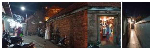
Gambar 12. Pintu keluar Peziarah ketika prosesi pembacaan al-Barzanji di Tajug