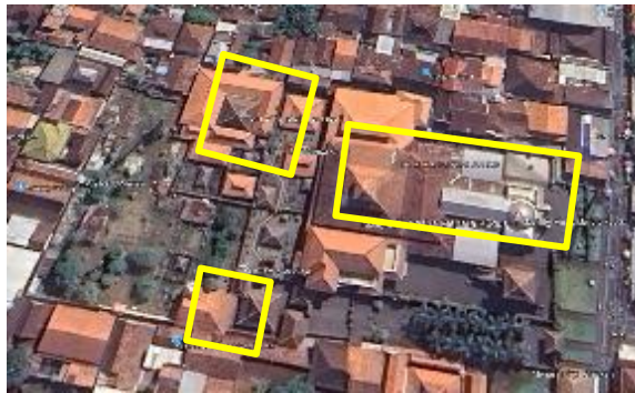
Gambar 4. Kawasan Inti Makam Sunan Kudus dan Masjid Al Aqsa

Proses persiapan brekat dilaksanakan di Jalan Menara Kudus dengan tiga kategori. Brekat shadaqoh, brekat Salinan, dan brekat umum. Persiapan brekat mulai dari penyembelihan hewan, proses memasak, dan membungkus brekat dilakukan di Gedung Menara Kudus. Pembagian untuk brekat shodaqoh dan brekat Salinan langsung di loket yang terletak di Jl Sunan Kudus. Sedangkan untuk brekat umum, Masyarakat mengikuti antrian yang secara terpisah antara putra dan putri.