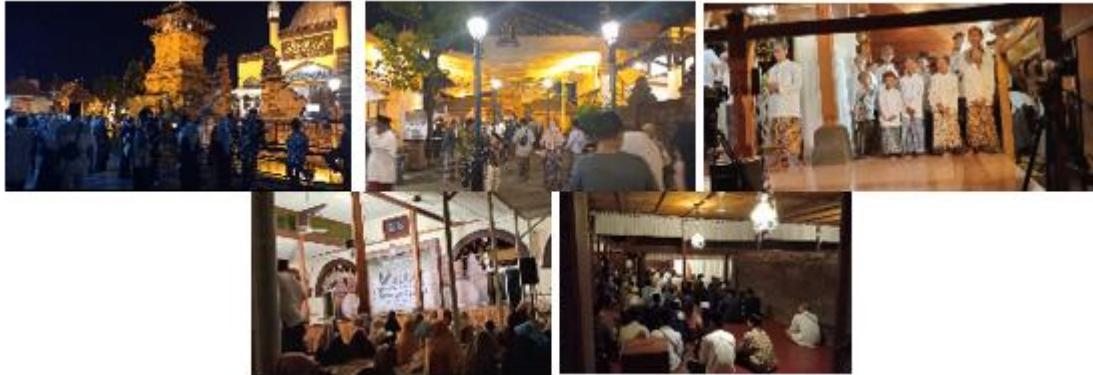
Gambar 2. Suasana Malam 10 Muharram 1447 H

6 Juli 2025. Kegiatan buka luwur diawali dengan jamas pusaka dan diakhiri dengan kegiatan inti pemasangan luwur Sunan Kudus.