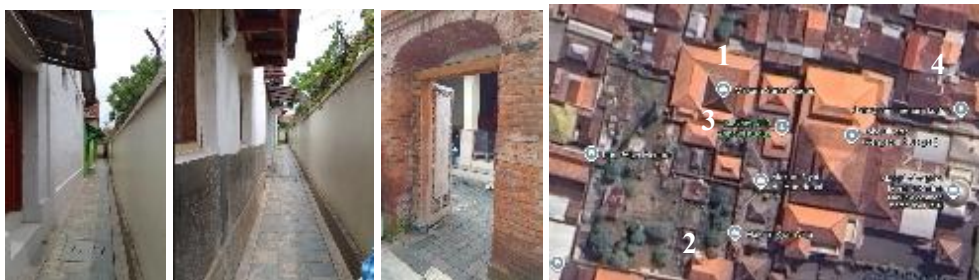
Gambar 9. Pagar kilungan yang mengelilingi kompleks Makam dan pawestren

Pagar kilungan saat ini masih banyak ditemukan di Desa Kauman dan Langgardalem, terutama yang berdekatan dengan pusat Kota Lama Kudus. Pagar kilungan biasanya mengelilingi dan menjadi bagian dari hunian, yang didalamnya juga terdapat bangunan untuk usaha. Selain itu, pagar kilungan juga ditemukan mengelilingi area makam Sunan Kudus dan pawestren masjid Al Aqsa (tempat sholat Perempuan). Pagar kilungan yang ada di kompleks Masjid (pawestren) dan Makam bukan hanya pembatas teritori namun juga sebagai pembatas akses, dan pembatas area sakral. Namun ketika berlangsung Buka Luwur, bentuk ruang pagar mengalami perubahan. Fenomena yang diamati, bukan hanya pagar kilungan masjid dan makam saja yang mengalami perubahan, namun juga pagar kilungan yang ada di area sekitar Makam dan menjadi jalur prosesi buka luwur.