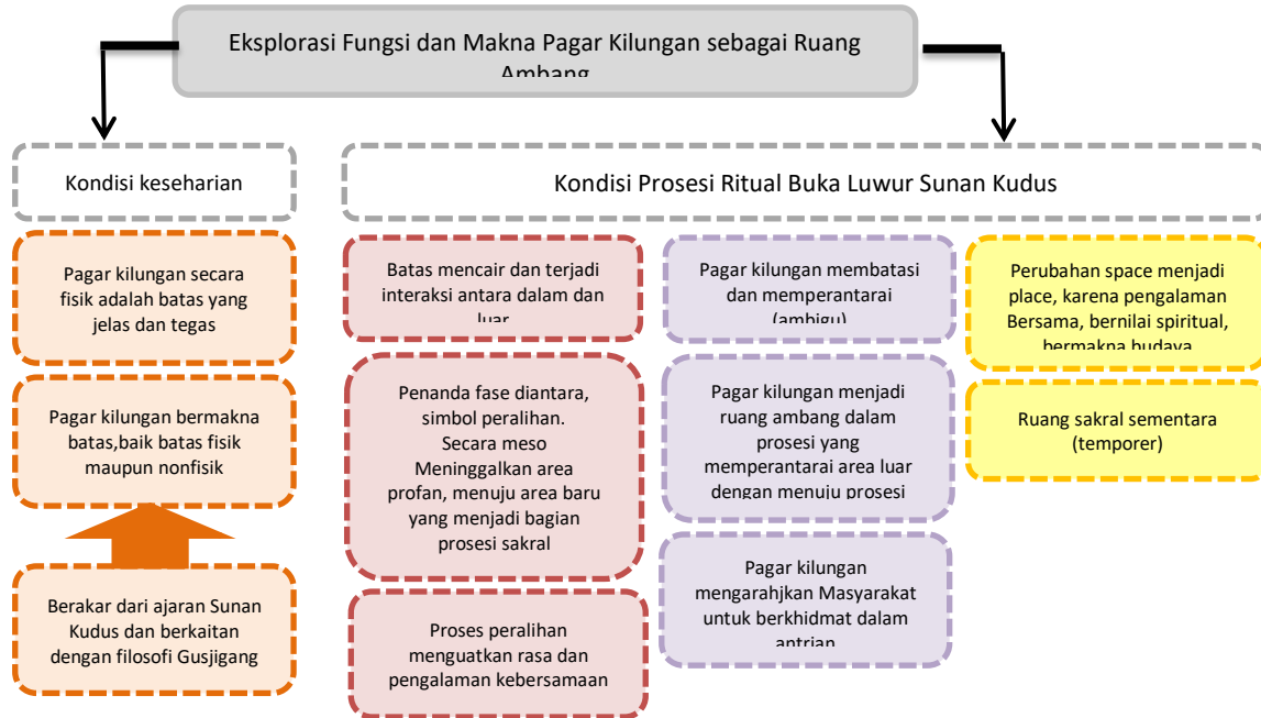
Gambar 8. Diagram Eksplorasi Fungsi dan Makna Pagar Kilungan sebagai Ruang Ambang (Sumber : Analisis, 2025)

berperan penting sebagai pengarah antrian penerimaan brekat sehingga menjadi area yang sakral karena berkaitan dengan prosesi. Ketika melewati lorong diantara pagar tersebut, ada pengalaman spiritual yang dialami bersama. Walaupun perubahan ini terjadi secara temporer namun hal ini sesuai dengan pandangan Yi-Fu Tuan (1977) tentang space dan place. Space dapat menjadi place jika dialami secara terus menerus. Namun place juga dapat menjadi space ketika kehilangan makna.