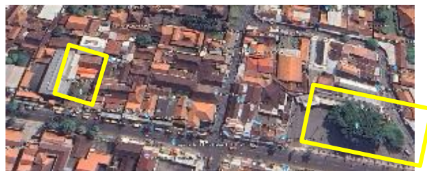
Gambar 5. Posisi Gedung Menara Kudus dan Alun-alun Kulon

Proses persiapan brekat dilaksanakan di Jalan Menara Kudus dengan tiga kategori. Brekat shadaqoh, brekat Salinan, dan brekat umum. Persiapan brekat mulai dari penyembelihan hewan, proses memasak, dan membungkus brekat dilakukan di Gedung Menara Kudus. Pembagian untuk brekat shodaqoh dan brekat Salinan langsung di loket yang terletak di Jl Sunan Kudus. Sedangkan untuk brekat umum, Masyarakat mengikuti antrian yang secara terpisah antara putra dan putri.