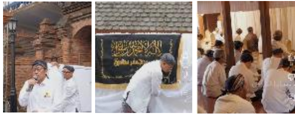
Gambar 3. Prosesi Inti Buka Luwur

Rangkaian kegiatan buka luwur Sunan Kudus berpusat di kompleks Makam Sunan Kudus dan Masjid Al Aqsa. Kegiatan jamas pusaka, pelepasan, pembuatan, dan pemasangan luwur, pembacaan barzanji, dilaksanakan di area tajug dan pesarean. Sedangkan kegiatan pengajian tahun baru, pengajian umum, khotmil Qur'an, bahtsul Masa'il, pembacaan dziba', doa rasul dan terbangun dilaksanakan di Masjid Al Aqsa. Kegiatan puncak yaitu upacara pemasangan luwur dilaksanakan di tajug dan pesarean. Selain kegiatan inti yang dilaksanakan di Area Makam Sunan Kudus dan Masjid Al Aqsa, ada kegiatan lain yang dilakukan di area Menara Kudus, yaitu pembagian brekat, pembagian bubur asyura, santunan anak yatim, dan pasar kuliner jadul. Keempat kegiatan ini dalam prosesnya menggunakan ruang-ruang sekitar Menara Kudus.