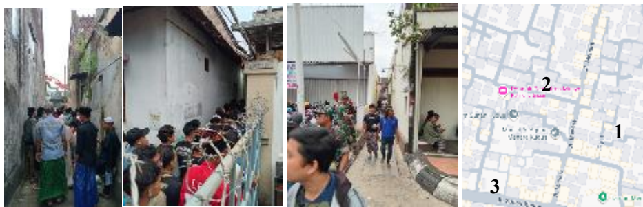
Gambar 7. Suasana Antrian Brekat Umum laki-laki

Pagar kilungan selama prosesi buka luwur tersebut bermakna ambigu karena membatasi dan memperantarai. Dalam prosesi antrian brekat, ruang ambang menjadi peralihan pergerakan dari luar ke dalam. Pergerakan dari luar ke dalam ini dalam konteks ritual komunal yang berkaitan dengan keberadaan seseorang di luar prosesi dan memasuki tahap prosesi. Pagar kilungan juga secara simbolik mengarahkan namun juga dengan tegas tetap membatasi apa yang ada di dalam pagar. Sehingga Masyarakat yang antri tetap boleh melintas namun tetap menghormati dan menjaga yang ada di dalam pagar kilungan. Hal ini sesuai dengan teori ruang ambang (Boettger, 2014) yang mempunyai karakteristik : (1) ambigu; (2) terjadi interaksi fungsi, norma, hal yang berbeda, dan (3) dapat mengubah perilaku pengguna.