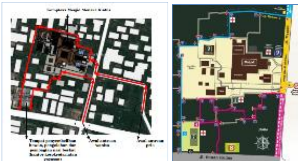
Gambar 13. Jalur antrian brekat umum tahun 2017 dan 2025

Berdasarkan pengamatan yang dilakukan Ashadi (2017) dijelaskan bahwa jalur antrian brekat untuk laki-laki dimulai dari Jalan Madureksan. Hal ini berbeda dengan pengamatan yang dilakukan pada 2025, dan penelusuran dokumen jalur antrean brekat tahun 2024. Pada tahun 2024 dan 2025, antrean brekat umum putra dimulai dari perempatan sucen kemudian masuk ke Gang Menara 1 dan mengikuti Lorong diantara kilungan hingga sampai ke jalan Sunan Kudus. Sedangkan untuk antrian putri berawal dari titik yang sama yaitu perempatan Menara dan berakhir di Gang Menara 2. Perbedaan pada jalur antrian putri adalah pada Lorong antar pagar kilungan menuju ke tempat pembagian brekat. Hal ini juga dapat diinterpretasikan bahwa ada ruang-ruang yang diproduksi ketika prosesi ritual-komunal.