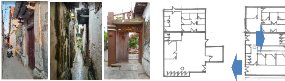
Gambar 6. Kanopi pada Pintu Gerbang Kilungan dan denah bangunan di dalam kilungan

pusat Kawasan tersebut terdapat rumah-rumah yang berada di dalam pagar kilungan. Pagar kilungan adalah elemen arsitektural yang banyak dijumpai di Kota Lama Kudus dengan bentuk fisik tembok tinggi yang mengelilingi rumah. Keberadaan pagar kilungan berkaitan dengan ajaran Sunan Kudus yang berakar dari toleransi, saling menghormati, serta menjaga diri. Sehingga pagar kilungan tidak hanya pembatas fisik namun juga bermakna secara simbolis. Dalam keseharian, peran pagar kilungan sebagai pembatas ini dapat dirasakan. Sehingga pintu gerbang yang ada di pagar kilungan dalam keseharian menjadi elemen perantara yang memisahkan antara luar dan dalam. Pagar kilungan secara tegas membatasi pandangan, memisahkan area luar dan dalam, dan secara meso menjadi pengarah akses/sirkulasi. Pada beberapa kasus, elemen pintu gerbang ini tidak hanya berupa fisik pintu namun juga secara abstrak membentuk ruang dengan pelingkup atas berupa kanopi yang mengatapi pintu.