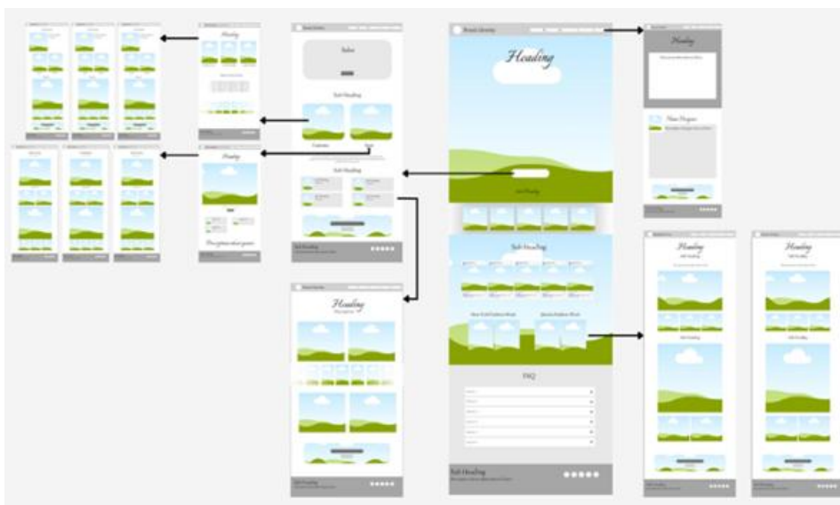
Gambar 2. Design E-katalog berbasis Website

Dalam tahap Develop , prototipe dikembangkan secara interaktif dan diuji oleh pemilik butik, ahli media, serta konsumen. Uji kelayakan awal dilakukan untuk memastikan bahwa setiap elemen desain berfungsi dengan baik, baik secara visual maupun teknis. Revisi dilakukan berdasarkan masukan pengguna, misalnya penyederhanaan tombol navigasi dan penambahan informasi produk pada koleksi. Proses ini juga mempertimbangkan aksesibilitas lintas perangkat agar katalog dapat dibuka melalui ponsel maupun laptop secara optimal tanpa gangguan tampilan.