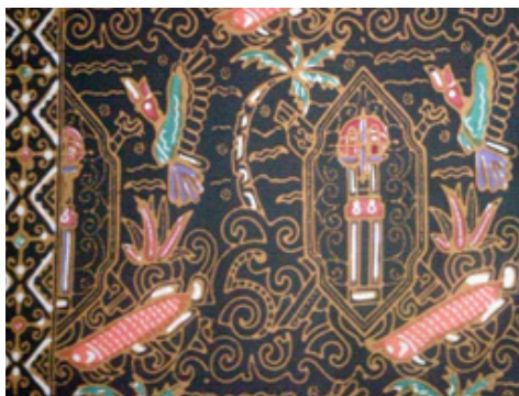
Gambar 2. Motif Pesona Kalimantan Barat