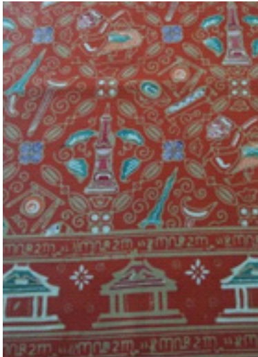
Gambar 3. Batik Cap Tolet