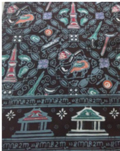
Gambar 1. Motif Pesona Yogyakarta

dan motif Pesona Kalimantan Barat (Tugu Khatulistiwa, Ikan Arwana Merah, Burung Enggang Gading, Ulur-Ulur Dayak, Kelapa Sawit, dan Lidah Buaya).