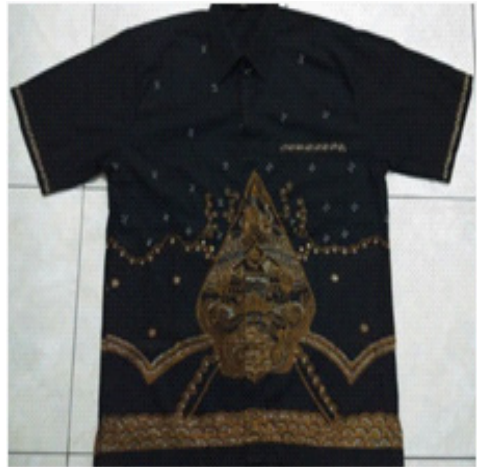
Gambar 5. Batik Tulis