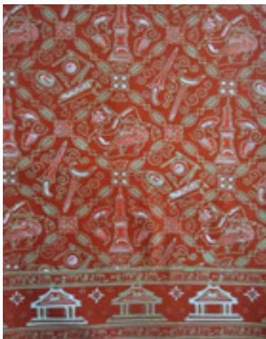
Gambar 4. Batik Cap Kesikan