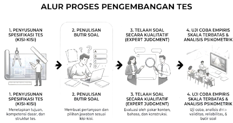
Gambar 1. Alur Proses Pengembangan Tes

Penelitian ini merupakan penelitian pengembangan ( developmental research ) yang secara spesifik difokuskan pada pengembangan instrumen asesmen. Prosedur pengembangan mengacu pada langkah-langkah penyusunan tes baku menurut Mardapi (2017). Mengingat fokus penelitian ini adalah untuk menghasilkan draf awal instrumen kognitif sistem Air Conditioning (A/C) kendaraan ringan yang teruji secara teoretis dan empiris awal, tahapan pengembangan dibatasi pada empat langkah krusial, yaitu: (1) penyusunan spesifikasi tes (kisi-kisi), (2) penulisan butir soal, (3) telaah soal secara kualitatif ( expert judgment ), dan (4) uji coba empiris skala terbatas beserta analisis psikometrik butir soal.