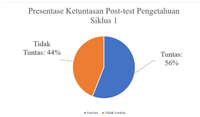
Gambar 3. Ketuntasan Post-test 1 Pengetahuan

Dengan persentase ketuntasan 40% dan 60%, maka PBL diterapkan pada empat pertemuan, dan menghasilkan nilai berikut pada post-test 1. Nilai tertinggi 88 poin, nilai terendah 70, dan rata-rata nilai 75 poin. Dengan demikian persentase ketuntasan sebesar 56% dan ketidaktuntasan 44% yang dapat dilihat pada gambar berikut: