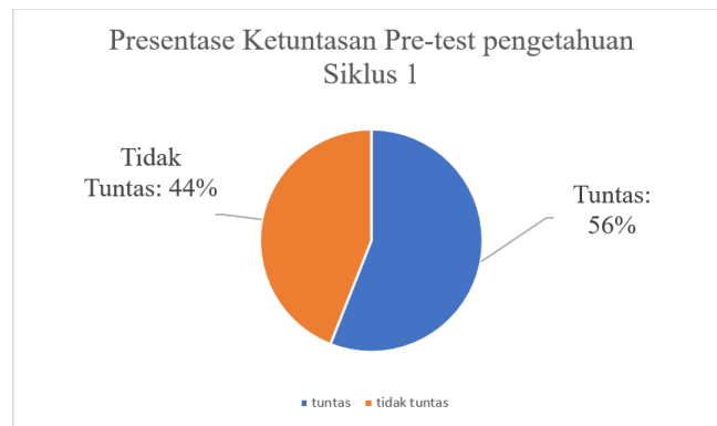
Gambar 1. Ketuntasan Pre-test Pengetahuan

Selain nilai untuk mengetahui nilai pengetahuan, pre-test juga bertujuan untuk mengetahui nilai keterampilan siswa. Pada pre-test untuk mengetahui nilai keterampilan, siswa diberikan 5 pertanyaan lisan berbentuk studi kasus dan praktik menggunakan alat. Setelah dilakukan pre-test, nilai pre-test pengetahuan siswa menunjukkan bahwa nilai tertinggi 83 poin, nilai terendah adalah 60 poin, dan rata-rata nilai 72 poin. Dengan demikian, persentase ketuntasan siswa adalah 48% dan ketidak tuntas 52%.