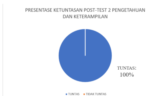
Gambar 5. Ketuntasan Post-test 2 Pengetahuan dan Keterampilan

Setelah empat pertemuan, dilakukan post-test 2, dengan hasil sebagai berikut.