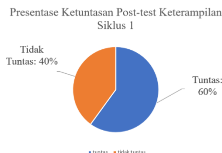
Gambar 4. Ketuntasan Post-test 1 Keterampilan

Selain nilai pengetahuan, nilai ketuntasan keterampilan juga mengalami kenaikan dengan 60% tuntas dan 40% tidak tuntas dengan nilai tertinggi 86, nilai terendah 72, dan rata-rata nilai 76.