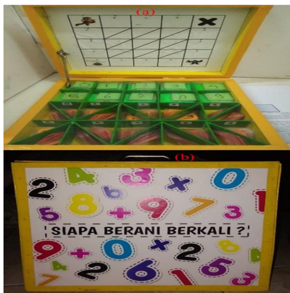
Gambar 3. Alat peraga “Kotak Siapa Berani Berkali”, (a) tampak dalam dan (b) tampak depan

Adapun hasil dari alat peraga “Kotak Siapa Berani Berkali” dapat ditunjukkan seperti pada Gambar 3.