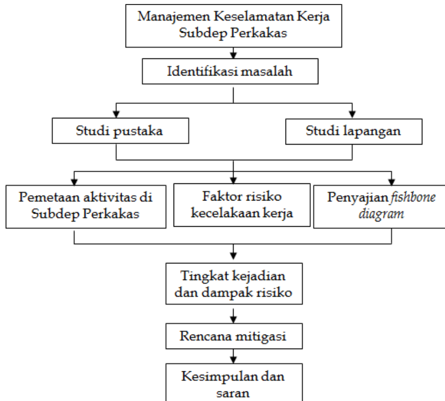
Gambar 2: Rerangka Pikiran