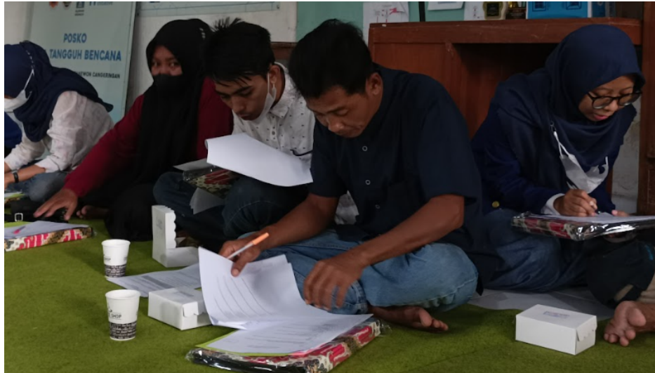
Gambar 2. Peserta Mempraktikkan Pengelolaan Arsip Keluarga

Hasil kegiatan menunjukkan bahwa peserta memiliki antusiasme yang tinggi selama pelatihan berlangsung. Hal ini terlihat dari keterlibatan peserta dalam sesi diskusi, praktik pengelompokan arsip, serta kemampuan peserta dalam menyusun kembali dokumen keluarga secara lebih rapi dan sistematis. Sebagian besar peserta menyampaikan bahwa sebelumnya mereka belum memahami pentingnya penyimpanan arsip keluarga sebagai bagian dari kesiapsiagaan bencana.