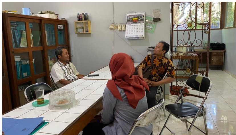
Gambar 3. Konsultasi dengan Ahli Pengelolaan Sampah Organik

Sebagai bagian dari perancangan program, tim kemudian melakukan konsultasi dengan ahli pengelolaan sampah organik (Gambar 3). Diskusi dengan narasumber ahli ini bertujuan untuk merumuskan strategi pendampingan yang sesuai dengan kebutuhan sekolah dan kondisi alat yang tersedia. Dari hasil konsultasi diperoleh rekomendasi mengenai metode pencacahan, penggunaan bio-aktivator untuk mempercepat proses komposting, serta mekanisme pelibatan siswa dalam praktik lapangan. Konsultasi ini memastikan bahwa program pengabdian dirancang tidak hanya berdasarkan kebutuhan sekolah, tetapi juga berlandaskan pengetahuan teknis yang tepat dan dapat diaplikasikan secara berkelanjutan.