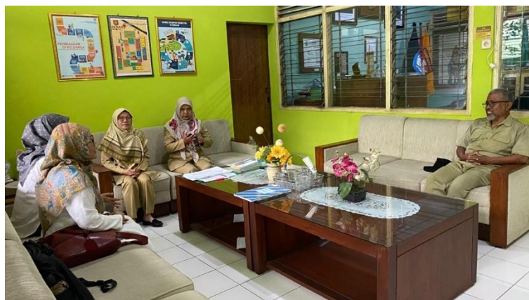
Gambar 1. Wawancara Bersama Pihak Sekolah

Tahap awal kegiatan pengabdian diawali dengan wawancara mendalam bersama pihak sekolah. Wawancara ini dilakukan dengan kepala sekolah, guru, serta tenaga kependidikan untuk memperoleh gambaran nyata mengenai kondisi pengelolaan sampah di SMP Negeri 12 Yogyakarta (Gambar 1). Melalui wawancara, terungkap bahwa pengelolaan sampah selama ini lebih terfokus pada sampah plastik, sedangkan sampah organik yang volumenya lebih besar belum dikelola secara sistematis. Proses ini penting untuk menggali potensi sekaligus permasalahan yang dihadapi sekolah, termasuk kesiapan sumber daya manusia, pengetahuan civitas sekolah, dan kebiasaan pengelolaan lingkungan yang telah berjalan.