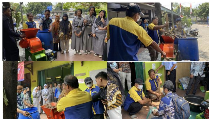
Gambar 5. Demonstrasi Penggunaan Alat Pencacah dan Proses Pengomposan

Setelah pemaparan materi, kegiatan dilanjutkan dengan demonstrasi penggunaan alat pencacah daun-ranting dan bio-aktivator untuk proses pengomposan (Gambar 5). Pada tahap ini, tim menyediakan alat pencacah, bio-aktivator, dan sampah organik dari lingkungan sekolah sebagai bahan praktik. Demonstrasi dimulai dengan penjelasan teknis cara mengoperasikan mesin pencacah, termasuk aspek keamanan dalam penggunaannya. Selanjutnya, hasil cacahan daun dan ranting dicampurkan dengan bio-aktivator untuk mempercepat proses dekomposisi. Proses eksekusi dilakukan secara langsung di hadapan peserta, sehingga guru dan siswa dapat melihat tahapan pengolahan dari bahan mentah hingga menjadi kompos siap fermentasi. Kegiatan ini tidak hanya berfungsi sebagai transfer pengetahuan, tetapi juga memberikan pengalaman praktis yang memperkuat pemahaman peserta tentang pengelolaan sampah organik yang efektif dan aplikatif di lingkungan sekolah.