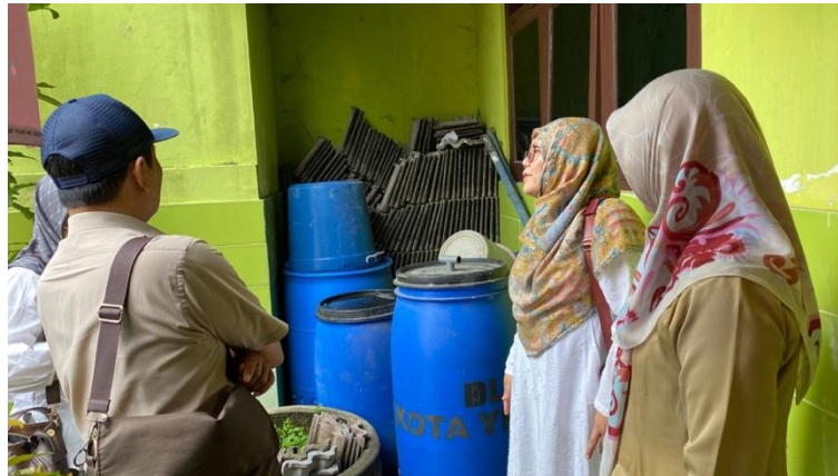
Gambar 2. Observasi Sarana dan Prasarana

Selanjutnya, tim pengabdian melakukan observasi terhadap sarana dan prasarana yang tersedia di sekolah (Gambar 2). Observasi ini bertujuan untuk memeriksa secara langsung ketersediaan alat bantu pengolahan sampah, seperti mesin pencacah dan reaktor kompos, yang sebelumnya telah diberikan oleh pemerintah. Selain memastikan ketersediaan, tim juga menilai kualitas dan kondisi fungsional alat, termasuk apakah masih dapat digunakan secara optimal atau memerlukan perbaikan teknis. Observasi juga mencakup tata letak area sekolah, lokasi pengumpulan sampah, serta potensi pemanfaatan lahan sekolah sebagai ruang praktik pengomposan.