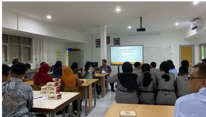
Gambar 4. Penyampaian Materi oleh Tim

Tahap pelatihan diawali dengan penyampaian materi mengenai pengelolaan sampah di lingkungan sekolah (Gambar 4). Materi diberikan oleh tim pengabdian dengan fokus pada pengenalan jenis-jenis sampah, baik organik maupun anorganik, serta urgensi pemilahan sejak dari sumber. Penekanan diberikan pada sampah organik karena volumenya paling dominan di SMP Negeri 12 Yogyakarta, terutama dari daun, ranting, dan sisa tanaman. Melalui sesi ini, guru dan siswa diajak memahami keterkaitan antara pengelolaan sampah organik dengan upaya menjaga kebersihan, keindahan, dan keberlanjutan lingkungan sekolah. Selain itu, konsep sekolah berwawasan lingkungan juga disampaikan untuk menumbuhkan kesadaran bahwa pengelolaan sampah tidak hanya berfungsi teknis, tetapi juga menjadi bagian integral dari pendidikan karakter dan budaya ekologis sekolah.