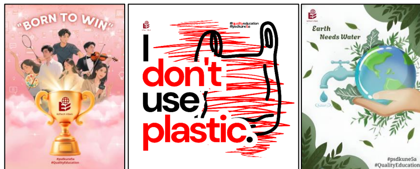
Gambar 1. Desain Grafis Poster Edukasi Digital

Hasil penelitian menunjukkan bahwa poster edukasi digital memiliki tingkat kelayakan yang tinggi pada seluruh elemen visual. Temuan ini mengindikasikan bahwa efektivitas media ditentukan oleh integrasi antar elemen keterbacaan, tipografi, warna, ilustrasi, dan tata letak dalam membentuk sistem komunikasi visual yang koheren. Secara kognitif, desain telah mampu mengelola beban informasi melalui penguatan hierarki visual dan penyederhanaan struktur pesan, sehingga mendukung pemahaman yang cepat dan akurat (Ahmad, 2019; Linde et al., 2022; Wang et al., 2024).