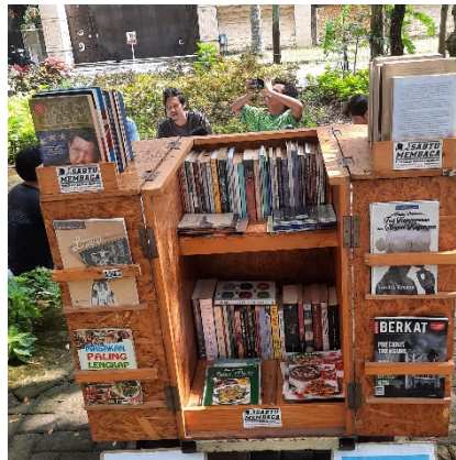
Gambar 2. Rak buku Sabtu Membaca

Membaca juga menawarkan kemudahan bagi pengunjung untuk meminjam buku dengan cara memberikan nomor telepon dan peminjam dapat memberikan update mingguan. Namun, Sabtu Membaca tidak memiliki database peminjaman buku untuk pendataan.