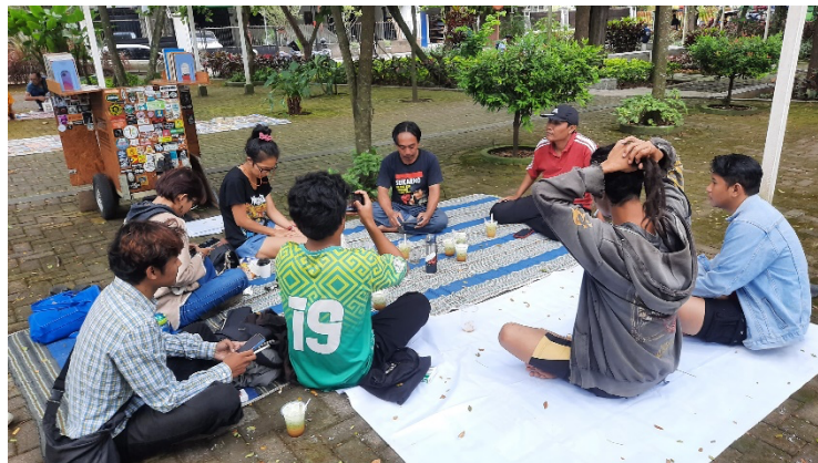
Gambar 1. Kegiatan diskusi buku di Sabtu Membaca

Perspektif Cak Pendek selaku pendiri perpustakaan jalanan Sabtu Membaca tentang literasi masyarakat adalah pandangan subjektif yang terbentuk dalam waktu bertahun-tahun. Meskipun tanpa melakukan penelitian yang tertulis, ia mulai menyadari dan melakukan sedikit penelitian secara informal. Rendahnya minat baca disebabkan oleh ketidakmampuan sebagian orang untuk mengakses buku. Buku tidak dianggap sebagai prioritas utama oleh sebagian besar pemuda. Mereka cenderung enggan untuk membeli buku, terutama karena harga yang semakin tinggi (Andina, 2017).