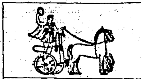
Gambar 2. Chariot

Cabang olahraga yang dilombakan/dipertandingkan pada Olympiade Kuno memang berkembang. Saat pertama kali diselenggarakan, 776 BC, hanya ada satu cabang olahraga yang dilombakan, yakni lari Stadia , kira-kira berjarak 192 meter. Dan pada abad kelima belas, saat pekan olahraga Olympiade mencapai puncaknya, cabang yang dilombakan/dipertandingkan ada 10 macam (CP, 1982, Vol.II: 46). Kemudian sejarah mencatat, pada Olympiade ke-128, kira-kira tahun 264 BC, yang muncul sebagai juara Chariot-race adalah: Bellisiche , seorang wanita dari Macedonia (Raymond Kennedy, 1971: 7). Dialah wanita pertama yang namanya tercatat sebagai juara pada pekan olahraga Olympiade (Kuno). Chariot-race adalah balap kereta kuda beroda dua, dengan si pengendara dalam posisi berdiri dan memegang tali kendali.