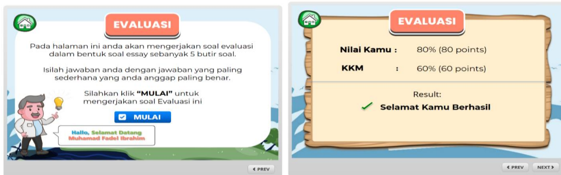
Gambar 3. Tampilan evaluasi

Selain penataan materi pada tampilan evaluasi terdapat petunjuk untuk menjawab soal evaluasi dan juga terdapat tombol mulai untuk memulai soal evaluasi. Soal evaluasi terdiri atas lima soal yang sudah dijelaskan pada materi. Dan juga terdapat result untuk menampilkan hasil apakah memenuhi KKM atau tidak. Tampilan hasil evaluasi ini ditunjukkan pada Gambar 3.