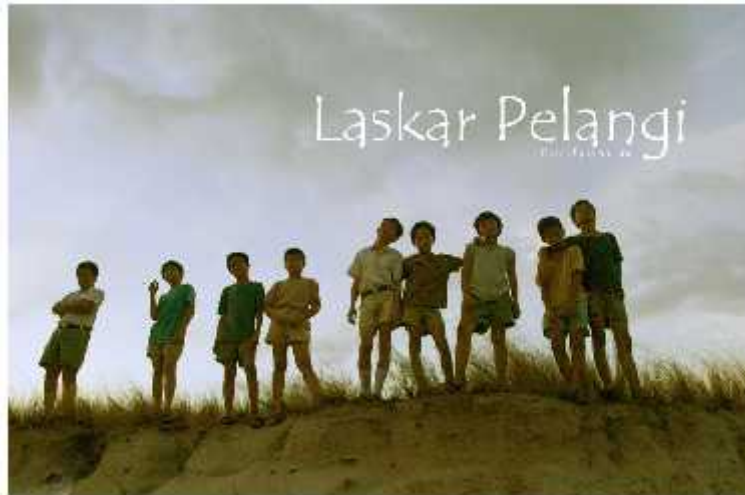
Gambar: "Laskar Pelangi" dan potret pendidikan Indonesia dulu sampai kini. (Jumat, 10 Oktober 2008, pk. 13:55:40, oleh: anonim)

Film "Laskar Pelangi" telah menyedot perhatian masyarakat di Indonesia termasuk Presiden Republik Indonesia, Dr. H. Susilo Bambang Yudhoyono. Film yang diambil dari novel karya novelis muda Andrea Herata ini menjadi film yang paling ditunggu dan tiketnya selalu terjual habis setiap harinya mulai sejak dirilis 25 September tempo hari.