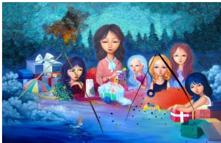
Gambar 3. Lukisan Oktaviyani, Tell Me a Story , Benang, Acrylic on canvas and Oil on canvas, 95x140cm, 2018

Lukisan kedua karya Oktaviyani yang berjudul Tell Me a Story merupakan karya lukis dengan ukuran 95 x 140 cm yang menampilkan enam karakter figur imajiner dengan warna cerah pada lukisan. Tell Me a Story jika diartikan kedalam bahasa Indonesia yaitu “Beritahu saya sebuah cerita” atau “ceritakan kepadaku”. Lukisan ini dibuat pada tahun 2018 dengan empat garis robekkan pada permukaan karya yang menjadi pusat perhatian selain objek utama pada karya. Lukisan Tell Me a Story merupakan salahsatu karya lukis Oktaviyani yang pernah di pameran di salah satu pameran berkelas di luar negeri yaitu pada pameran BAMA ( Busan Annual Market of Art ) di Korea Selatan pada tahun 2020. Pada pameran tersebut terdapat dua karya lain saat di pameran. Tidak hanya sekedar dipamerkan, lukisan yang di tampilkan pada pameran tersebut juga mempunyai nilai jual yang cukup tinggi sesuai dengan tingkat kerumitan pada detail karya. Lukisan Tell Me a Story memadukan material benang pada permukaan latar belakang lukisan, dan tidak semua permukaan lukisan di padukan dengan benang. Pada objek figur dan objek pendukung lainnya tidak ditambahkan benang. Lukisan Tell Me a Story menampilkan visual wanita pada lukisan Oktaviyani.