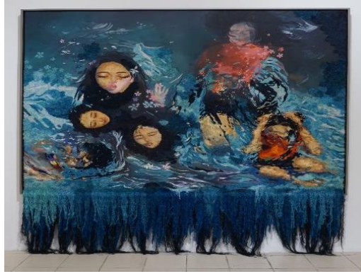
Gambar 2. Lukisan Oktaviyani, Deep Healing 2021, Acrylic on canvas, benang jahit, (250 x 200 cm)