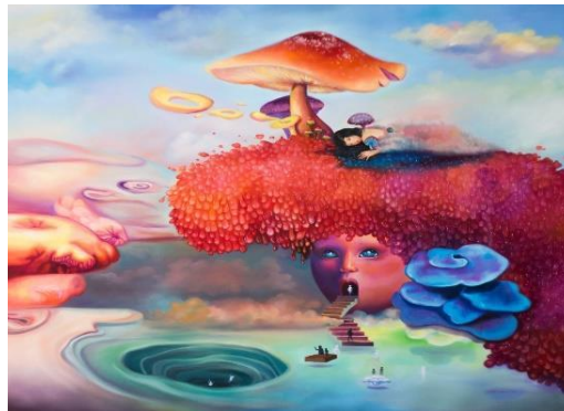
Gambar 4. Lukisan Oktaviyani, Moonchild Oil on canvas, 100x100cm, 2016

Lukisan ketiga berjudul Moonchild merupakan karya lukis Oktaviyani yang di buatnya pada tahun 2016 dengan ukuran 100 x 100 cm. lukisan berjudul Moonchild menggunakan cat minyak pada permukaan lukisan. Berbeda dari karya lukis sebelumnya, lukisan ini tidak memadukan dengan tekstur benang pada permukaan lukisannya Pada tahun 2020 karya lukis Moonchild pernah dipamerkan di BAMA ( Busan Annual Market of Art ) di Korea Selatan sama dengan karya lukis Tell Me a Story . Karya lukis yang berjudul Moonchild ini menampilkan warna-warna yang cerah pada lukisannya dan objek lukisan yang sangat surealistik. Tokoh atau figur manusia pada lukisan menampilkan ukuran yang lebih kecil dari objek suasana yang lebih luas.