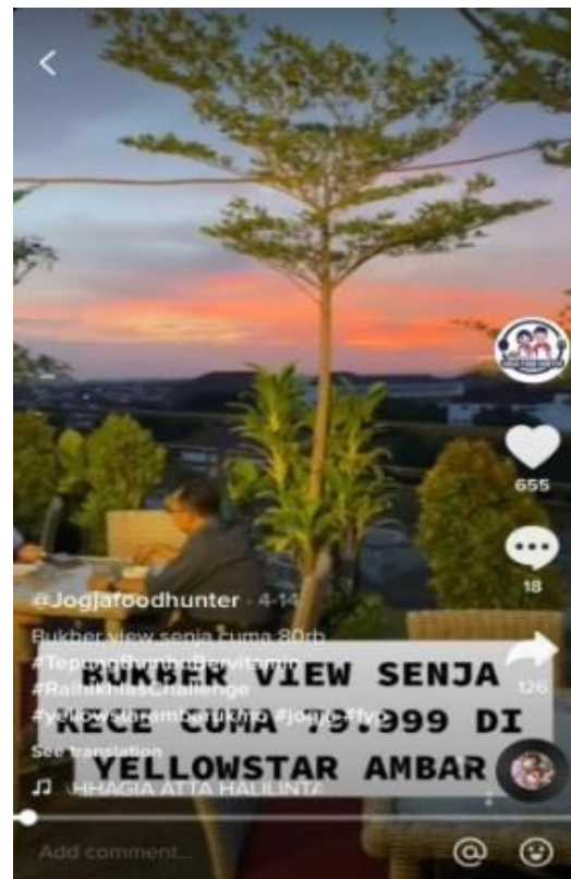
Gambar 2. Teknik Iklan Pada Akun @jogjafoodhunterofficial 14/04/2021 ( https://vt.tiktok.com/ZSJBSEm1/ )

Krisna Oleh-Oleh Khas Bali". Dalam penelitian ini disebutkan bahwa iklan menjadi teknik digital marketing yang dilakukan oleh Krisna oleh-oleh kas Bali. Teknik iklan dalam akun Tiktok @jogjafoodhunterofficial menggunakan kalimat persuasif dan yang diiklankan merupakan sebuah toko atau warung yang bersifat nonpersonal. Dalam konten yang dianalisis peneliti, menunjukkan bahwa teknik iklan disertai dengan penjelasan yang detail dan informatif. Hal ini sesuai dengan pernyataan yang dipaparkan oleh Ha, Y. W., Park, M. C., & Lee, E. (2014) iklan juga harus bersifat informatif.