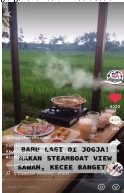
Gambar 3. Teknik Story Telling Pada Akun @jogjafoodhunterofficial 31/03/2021 ( https://vt.tiktok.com/ZSJBSTLo/ )

Teknik story telling juga ditemukan pada digital marketing yang dilakukan oleh brand fashion besar dunia, seperti Prada, Chanel, dan Louis Vuitton. Temuan ini dituliskan dalam penelitian yang dilakukan oleh Romo, Z. F. G., Medina, I. G., & Romero, N. P. (2017) dengan judul “ Storytelling and Social Networking as Tools for Digital and Mobile Marketing of Luxury Fashion Brands ”. Hal ini menunjukkan bahwa story telling menjadi salah satu teknik digital marketing yang sering digunakan dalam media sosial.