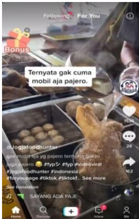
Gambar 4. Teknik Komedi Pada Akun @jogjafoodhunterofficial 28/02/2021 ( https://vt.tiktok.com/ZSjhft8je/ )