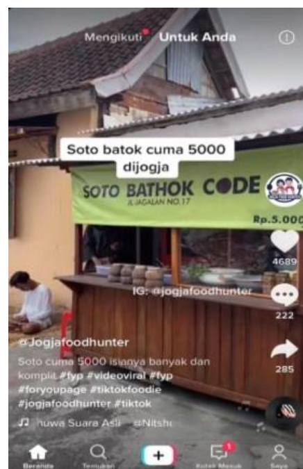
Gambar 11. Penggunaan teknik testimoni pada konten @jogjafoodhunterofficial 20/03/2021 ( https://vt.Tiktok.com/ZSJrVGdPe/ )