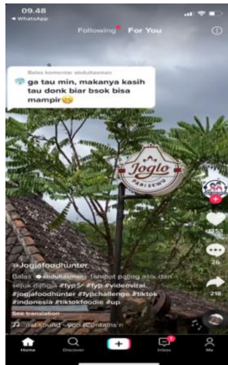
Gambar 6. Teknik Feedback Pada Akun @jogjafoodhunterofficial 14/02/2021 ( https://vt.Tiktok.com/ZSJrq1vYD/ )

Dalam penelitian ini, penelitian menemukan temuan terbaru pada konten digital marketing di akun @jogjafoodhunterofficial. Pada konten tersebut terdapat penambahan penggunaan audio musik. Jadi dalam konten tersebut tidak hanya menampilkan video saja, tetapi juga terdapat audio musik. Penggunaan audio musik pada konten digital marketing di akun @jogjafoodhunterofficial sangat sering digunakan. Pasalnya bisa dilihat dalam akun Tiktok @jogjafoodhunterofficial hampir semua konten yang ada di akun Tiktok tersebut menggunakan audio musik dalam konsep digital marketingnya.