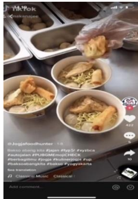
Gambar 10. Penggunaan teknik cashback pada konten @jogjafoodhunterofficial 8/01/2021 ( https://vt.Tiktok.com/ZSJrq1KTx/ )

cashback “nah lagi banyak promo nih di bakso abang kita, ada promo 25 ribu, ada cashback 45 ribu dan ada diskon ongkir juga”. Seperti yang sudah dibahas di atas, bahwa penggunaan teknik sales promotion ini kerap digunakan dalam digital marketing .