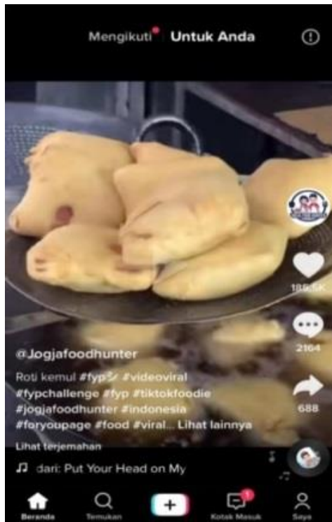
Gambar 7. Penggunaan audio musik pada akun @jogjafoodhunterofficial 27/10/2020 ( https://vt.tiktok.com/ZSjBSJS2F/ )

testimoni dan cashback ini juga ditemukan dalam digital marketing pada konten akun Tiktok @jogjafoodhunterofficial. Berdasarkan analisis konten pada akun Tiktok @jogjafoodhunter, penerapan sales promotion dalam digital marketing cukup menarik perhatian para pengguna akun Tiktok.