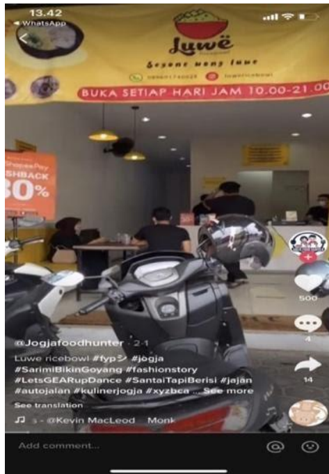
Gambar 9. Penggunaan teknik diskon pada konten @jogjafoodhunterofficial 01/02/2021 ( https://vt.Tiktok.com/ZSJrqeW4r/ )

Gambar 9 menunjukkan teknik sales promotion berupa diskon atau potongan harga. Diskon merupakan pengurangan langsung dari harga barang pada pembelian pada suatu periode tertentu yang sudah ditentukan (Kotler, P., & Armstrong, G., 2004). Gambar 9 berasal dari salah satu konten digital marketing yang ada di akun Tiktok @jogjafoodhunterofficial. Konten tersebut berupa video dengan ada satu informan yang berbicara. Dalam konten tersebut informan mengatakan “nah lagi ada promo opening mantul nih gaes, beli 1 gratis 1 dan diskon 20% all menu, sampai tanggal 2 februari”. Menerapkan sales promotion berupa diskon dalam digital marketing memang menjadi daya tarik sendiri bagi para pengguna untuk melihatnya. Hal tersebut terlihat dalam jumlah viewers yang mencapai hingga 20,4 ribu pada tanggal 14 April 2021.