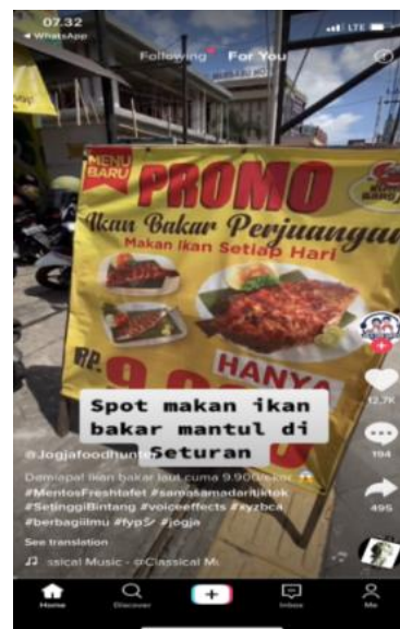
Gambar 8. Penggunaan teknik promosi pada konten @jogjafoodhunterofficial 25/09/2020 ( https://vt.tiktok.com/ZSjrVn9Ej/ )

Pada Gambar 8, bisa dilihat bahwa terdapat teknik sales promotion berupa promo dalam konten digital marketing pada akun Tiktok @jogjafoodhunter. Menurut Tjiptono, F. (2008) promosi adalah elemen bauran pemasaran yang mana bertujuan sebagai upaya memberikan informasi, membujuk, serta mengingatkan kembali kepada konsumen akan merek dan produk suatu perusahaan. Konsep sales promotion pada konten tersebut juga dinarasikan oleh informan "Haaa.. Promo ikan bakar hanya 9.900 per ekor". Menggunakan teknik sales promotion tersebut bertujuan untuk menarik para pengguna Tiktok. Hal tersebut bisa dibuktikan pada konten digital marketing di atas, jumlah viewers mencapai hingga 248,5 ribu pada tanggal 14 April 2021.