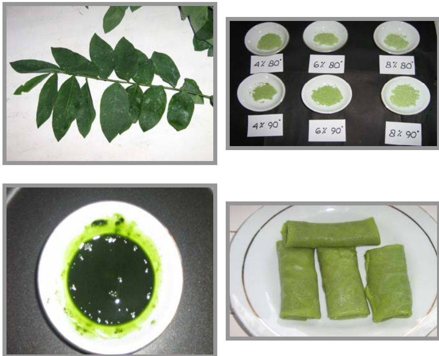
Gambar 2 Aplikasi pewarna alami bubuk ekstrak daun katuk

Aplikasi pewarna alami bubuk ekstrak daun katuk pada salah satu makanan yaitu dadar gulung, dapat dilihat pada gambar 2.