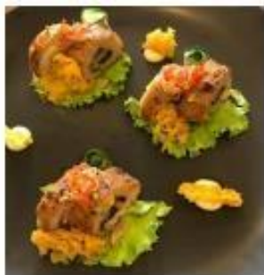
Produk Rice Roll Tuna Sambal Matah