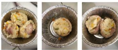
Produk Rice Roll Tuna Formula I Produk Rice Roll Tuna Formula II Produk Rice Roll Tuna Formula III

Gambar 4. Tahap Design