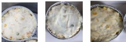
Resep I Steam Rice Resep II Steam Rice Resep III Steam Rice

Resep ditentukan dengan melihat kriteria dari produk yang diinginkan. Kriteria Rice Steam yang diinginkan adalah teksturnya yang tidak terlalu lembek dan nasi tidak memisah. Rasanya rempah dengan khas aroma pala supaya dapat menyamakan rasa amis ikan tuna. Aroma yang dihasilkan harum nasi steam khas. Warna yang dihasilkan kuning muda. Tiga resep dasar yang telah dipilih kemudian dipraktikkan. Setelah diuji coba dari ketiga resep dasar steam Rice, maka didapatkan hasil dari uji coba tiga resep tersebut.