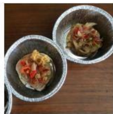
Produk Rice Roll Ikan Tuna Sambal Matah Validasi I