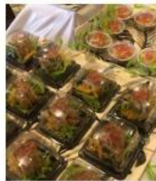
Produk Rice Roll Tuna Sambal Matah