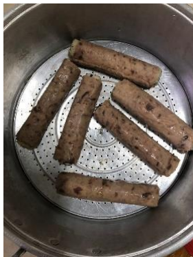
Gambar 2. Proses pembuatan Rice Roll Tuna

Pembuatan daging ikan tuna supaya menjadi tipis dan dapat digulung yaitu dengan menghancurkan daging ikan tuna segar, tidak sampai terlalu halus. Kemudian tambahkan putih telur dengan perbandingan daging ikan tuna: putih telur sebesar 5:1. Aduk hingga merata kemudian masukkan kedalam plastik, dan pipihkan. Simpan dalam glass freezer hingga beku. Pembuatan nasi, cukup campurkan bawang putih, Bombay, masukkan sayuran dan nasi, kemudian tambahkan susu dan kuning telur serta seasoning. Gulung nasi dalam nori dan masukkan gulungan tersebut kedalam ikan tuna yang sudah beku. Proses ini perlu dilakukan dengan cepat, karena lebih dari 1 menit di suhu ruang, daging ikan tuna dapat hancur. Kukus selama 15 menit, dan torch rice roll tuna Sambal Matah .