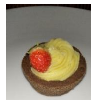
Gambar. 1 Pie Cream Cheese

Dengan menggunakan nilai dengan rentang 1-5. Produk acuan dengan parameter sensoris keseluruhan mendapatkan skor 228 dengan rerata 4,45. Dan pada produk Pengembangan mendapatkan skor 231 dengan rerata 4,65.