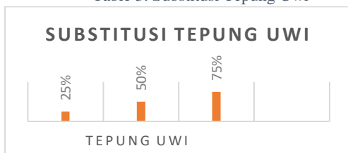
Table 3. Substitusi Tepung Uwi

Pada tahap ini merancang formula resep dan merancang produk yang tepat. Setelah ditemukan resep acuan yang dianggap paling cocok, setelah itu ditambahkan dalam produk Pie Cream Cheese dengan menambahkan tepung uwi sebanyak 25%, 50% dan 75%.