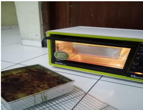
Gambar 1. Dokumentasi Produksi Kue Lapis Kojo

menggunakan api atas dan bawah, panggang hingga permukaan menjadi warna coklat. Selanjutnya lapisan kedua dan seterusnya kue lapis kojo menggunakan api atas dengan suhu 180°C sampai adonan habis. Pada tahapan terakhir pelapisan kue lapis kojo menggunakan api atas bawah kembali dengan pengaturan suhu yang sama. Berikut adalah hasil gambar dari produksi kue lapis kojo.