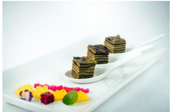
Gambar 2. Kue Lapis Kojo Tepung Ganyong

Hasil validasi menunjukkan produk kue lapis kojo dapat diterima dan disukai oleh validator.