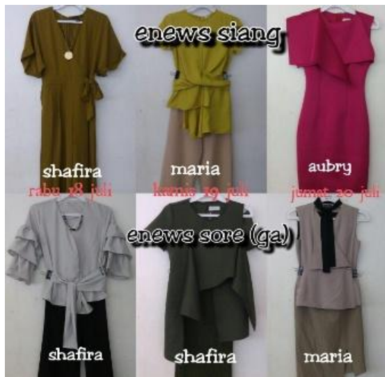
Gambar 1. Hasil Daily Styling

Styling di Wardrobe NET dibagi menjadi dua, yaitu stylingpreprogram dan styling on duty . Styling preprogram merupakan penataan gaya berpakaian yang tidak dilakukan pada hari program acara berlangsung. Styling preprogram dibagi menjadi dua yaitu daily styling dan breakdown styling . Daily styling bertugas menyiapkan look berupa atasan, bawahan dan aksesoris sesuai dengan standar yang berlaku. Kemudian look yang sudah disiapkan akan diambil gambar dan di- edit menggunakan aplikasi collage untuk menjadi panduan bagi stylist on duty . Berikut salah satu hasil photo collage dari styling yang sudah disiapkan oleh preprogram stylist .