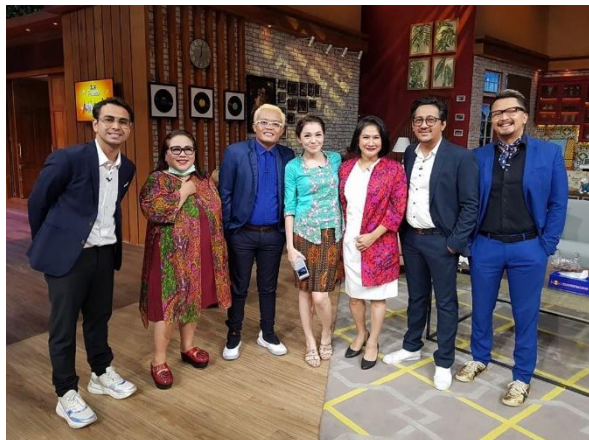
Gambar 3. Look Pembawa Acara Ini Talkshow

terakhir memasukkan pakaian ke kantong laundry pakaian kotor yang telah dipakai. Sehingga stylist on duty menangani kebutuhan suatu program acara yang membutuhkan wardrobe pada saat shooting di studio maupun di luar studio. Stylist on duty juga memiliki tanggung jawab yaitu menjaga pakaian dari segi kerapihan dan segi keselarasan penampilan (warna, bentuk badan pembawa/pengisi acara, lighting, background, flicker) dan aksesoris saat dipakai sesuai styling. Apabila ada perubahan gaya pakaian, stylist on duty akan menghubungi stylist preprogram daily ataupun breakdown . Selain itu menjaga kebersihan ruangan yang dipakai ketika on duty . Berikut adalah contoh hasil styling dari preprogram styling yang dikenakan oleh pembawa acara.