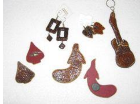
Gambar 8. Hasil kegiatan: Gantungan kunci, hiasan kulkas, anting dan pin (bros)