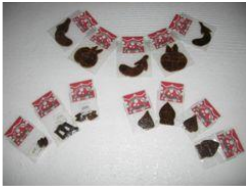
Gambar 9. Hasil kegiatan dikemas dengan plastik kaca dan diberi label yang siap dipasarkan