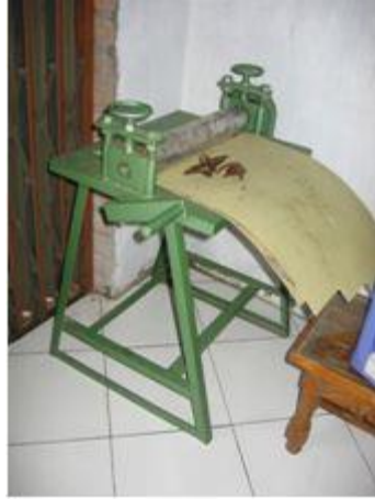
Gambar 2. Mesin untuk meratakan kulit salak