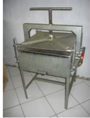
Gambar 3. Mesin pres dengan pemanas