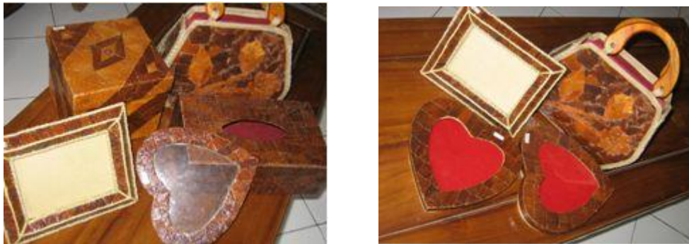
Gambar 1. sebagian dari produk yang sudah dibuat, berupa tas, pigura tempat perhiasan tempat tissue dan box

Pada tahap persiapan ini dapat juga dilakukan pada lembaran kertas yang sudah ditempel kulit salak, kemudian di pres dengan mesin pres pemanas. Jika sudah rata, baru dipotong sesuai model yang dikendaki. Pada cara yang kedua ini, jika potongan disambung atau dihubungkan dengan potongan lainnya, menimbulkan celah yang harus ditutupi dengan materi lain, misalnya aneka jenis tali atau bahan penutup lainnya misalnya benang nylon. Hasil yang diperoleh tentu berbeda dengan hasil pada cara pertama, justru pada model ini terdapat perpaduan bermacam materi yang memerlukan ketrampilan tertentu dalam cara memilih, mengkombinasikan dan menyelesaikan dengan teknik yang bervariasi.