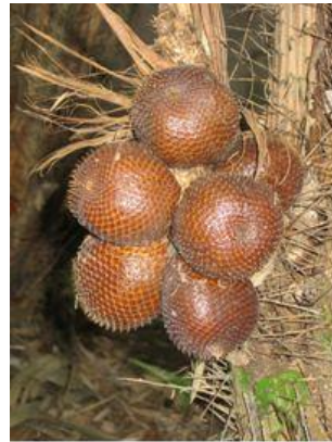
Gambar 5. Buah Salak masih segar di pohon, dipetik, dikupas, kulit buahnya dilayukan digunakan sebagai bahan utama dalam pembuatan souvenir dan aksesoris.