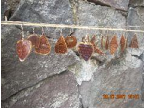
Gambar 7. Proses pengeringan