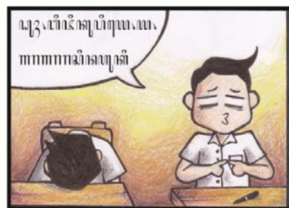
Gambar 7. Kocil Aja "Ardhi lan Dhanar" halaman 1 - 6