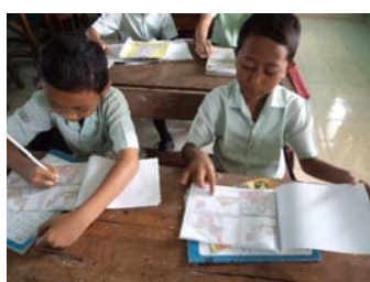
Gambar 4. Siswa mencermati Kocil Aja "Aku Telat"