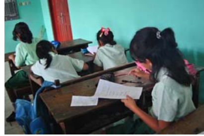
Gambar 9. Siswa mengerjakan soal Postest