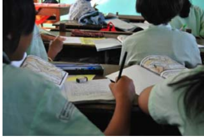
Gambar 8. Siswa menulis kalimat yang ada pada Kocil Aja "Ardhi lan Dhanar" pada buku tulis