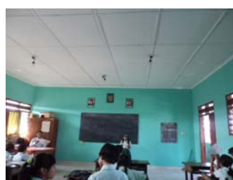
Gambar 5. Siswa maju ke depan kelas untuk membaca Kocil Aja "Aku Telat"

Siklus 2 dilakukan dengan 1 kali pertemuan. Siswa membaca Kocil Aja "Ardhi lan Dhanar" , mencatat kalimat dialog di buku catatan, kemudian mengerjakan soal postes. Pembelajaran berlangsung lancar dan menyenangkan. Sebanyak 91 % siswa senang dan bersemangat dalam membaca Kocil Aja "Ardhi lan Dhanar" . Nilai rata-rata kelasnya pun meningkat menjadi 55.