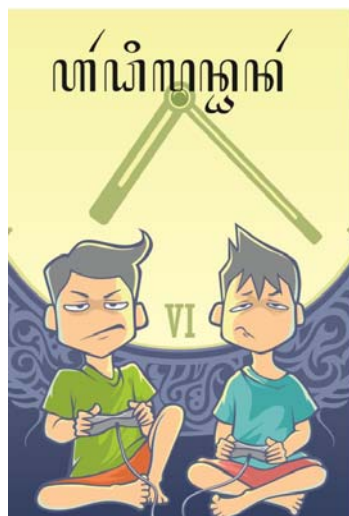
Gambar 6. Sampul Kocil Aja "Ardhi lan Dhanar"

Siklus 2 dilakukan dengan 1 kali pertemuan. Siswa membaca Kocil Aja "Ardhi lan Dhanar" , mencatat kalimat dialog di buku catatan, kemudian mengerjakan soal postes. Pembelajaran berlangsung lancar dan menyenangkan. Sebanyak 91 % siswa senang dan bersemangat dalam membaca Kocil Aja "Ardhi lan Dhanar" . Nilai rata-rata kelasnya pun meningkat menjadi 55.