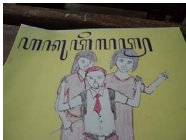
Gambar 3 Kocil Aja "Aku Telat"

Perbedaan juga dilakukan pada proses mentranslit aksara Jawa ke aksara latin. Agar lebih dapat mentranslit, siswa mencatat kalimat yang ada pada Kocil Aja di buku catatan.