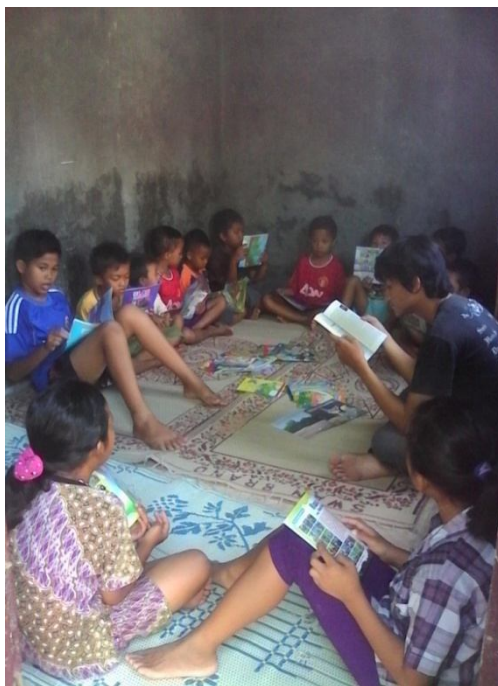
Gambar 1. Suasana saat Kegiatan Minggu Baca

diketahui siswa kelas 1 SMK, dan dibantu oleh 5 siswa SMP dan SMK ataupun SMA. Pengelola juga membuat jadwal untuk menjaga taman belajar agar tetap dapat dikunjungi oleh masyarakat.