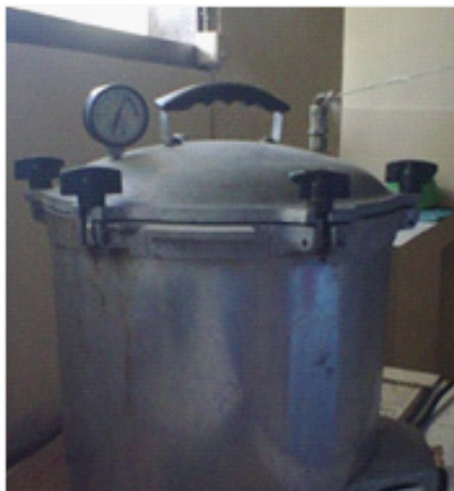
Gambar 3. Sterilisasi Alat untuk Fermentasi Menggunakan Autoclave