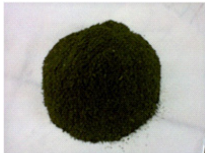
Gambar 2. Alga spirogyra sp. Hasil Preparasi