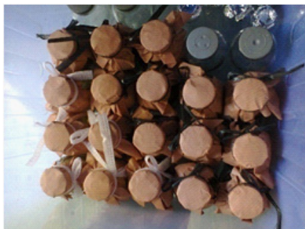
Gambar 5. Proses Fermentasi oleh Saccharomyces cerevisiae