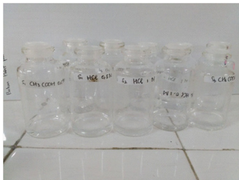
Gambar 6. Bioethanol yang Telah Didestilasi