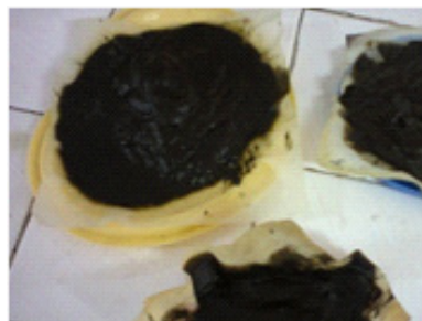
Gambar 4. Hasil Hidrolisis Alga