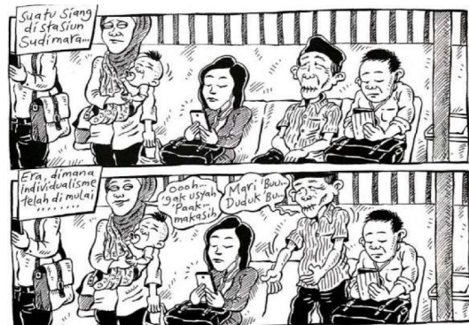
Gambar 8. Strip komik halaman 47 Indonesia Banget! 2

berapa simbol. Dalam panel tersebut menggambarkan telepon pintar yang menutupi mata aktor Mice disertai dengan tali pengikat yang menyerupai kacamata kuda. Mice digambarkan tidak bisa melihat apapun dan tangannya mengarah ke depan sebagai tanda bahwa dirinya meraba-raba jalan. Gambar strip komik menggunakan sebuah analogi bahwa telepon pintar menutup mata manusia. Makna dibalik menutup mata manusia adalah semua fokus manusia saat ini hanya untuk telepon pintar yang menimbulkan ketidakpedulian pada sekitar. Tanpa elemen verbal di dalamnya, strip komik halaman 32 menggambarkan tentang individualisme akibat gawai khususnya telepon pintar.