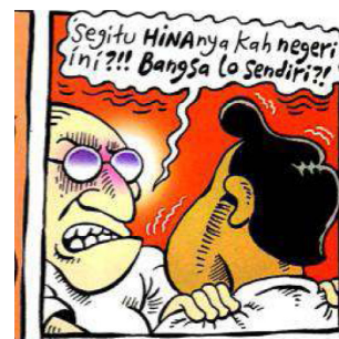
Gambar 10. Balon kata dengan penekanan pada penebalan kata (bold)

Selain Leon, Mice mengungkapkan makna Indonesia banget melalui ucapan dalam balon kata. Dalam panel tersebut ia memprotes Indonesia Banget yang diucapkan oleh aktor Leon secara berulang-ulang. Dalam balon kata terdapat aspek paralinguistik berupa penekanan dalam kata “CAP” yang ditulis menggunakan huruf kapital serta dicetak tebal. Artinya Orang Indonesia adalah cap, dan cap adalah stereotip.