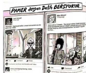
Gambar 19. Halaman 34 strip komik Indonesia Banget! 2

Strip komik halaman 34 Indonesia Banget! 2 berjudul “Pamer dengan Dalih Bersyukur”. Terdapat dua aktor yaitu Mice dan Leon yang digambarkan melalui akun media sosial Facebook . Ruang dalam kedua panel strip komik tersebut adalah ruang fitur status Facebook . Anatomi waktu dalam panel tersebut ditunjukkan melalui waktu aktor mengunggah gambar dan status dalam fitur status Facebook .