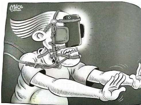
Gambar 7. Strip komik halaman 32

Stereotip atau cap Orang Indonesia juga terdapat dalam strip komik “Dulu” dan “Kini”. Dalam panel “Dulu”, istilah Dulu adalah ruang dan waktu yang diharapkan dan diekspektasikan indah oleh aktor dan pembaca. Sedangkan “Kini” ruang dan waktu masa kini yang tidak diharapkan. Hal tersebut mengkonstruksi sebuah wacana bahwa ruang dan waktu Dulu lebih baik daripada sekarang. Anak-anak yang bermain di luarrumah adalah sesuatu yang dianggap ideal. Sedangkan anak-anak yang bermain gawai dalam ‘Kini’ adalah sesuatu yang dianggap tidak ideal.