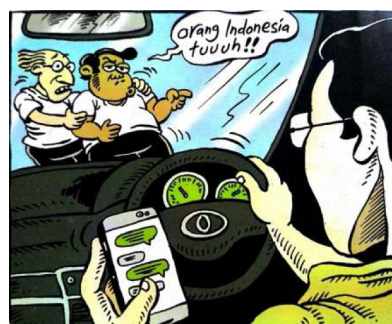
Gambar 11. Panel pertama halaman pembuka strip komik Indonesia Banget! 2

Sumber daya: Panel Pertama dalam Halaman Pembuka pertama