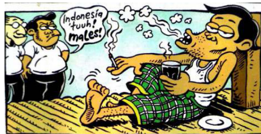
Gambar 13. Panel ketiga halaman pembuka strip komik Indonesia Banget! 2

Panel ketiga halaman pembuka strip komik Indonesia Banget! 2 menggambarkan tiga aktor yaitu Mice, Leon dan seorang pria. Ketiga aktor tersebut ada di dalam ruang panel ketiga halaman pembuka yang identik dengan sebuah ikon yaitu dipan kayu. Anatomi wacana waktu adalah panel kedua halaman pembuka strip komik. Aktor Mice dan Leon digambarkan sedang berdiri sambil melihat seorang pria yang sedang duduk bersandar di atas sebuah dipan kayu. Pria tersebut duduk bersandar sambil menikmati kopi dan rokok yang ada di kedua tangannya. Melihat pria tersebut, Leon mengatakan “Indonesia ‘tuuh! males!’” dalam balon kata yang merujuk pada pria yang mereka lihat. Aspek parabahasa berupa penebalan dalam tanda seru dan kata males (malas) yang diucapkan dengan nada meninggi.