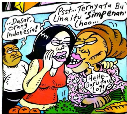
Gambar 14. Panel keempat halaman pembuka strip komik Indonesia Banget! 2

Sumber daya: Panel keempat halaman pembuka pertama strip komik