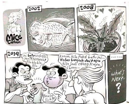
Gambar 19. Halaman 22 strip komik Indonesia Banget! 2

Sumber daya: Halaman 22 strip komik Indonesia Banget!2