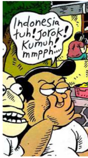
Gambar 3. Balon kata yang diucapkan oleh Leon mengenai Indonesia

Dalam panel tersebut, secara jelas Leon mengucapkan bahwa Indonesia jorok dan kumuh. Hal tersebut diper-tegas lagi dengan adanya penebalan dalam tanda baca setelah jorok dan kumuh. Selain penggambaran sifat secara langsung, dalam panel halaman pem-buka, Leon mengucapkan kembali dalam balon kata "...Dasar Orang Indonesia!". Perkataan tersebut merupakan wacana mengenai "Orang Indonesia" yang gemar bergosip.