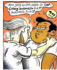
Gambar 9. Balon kata dengan penekanan pada penebalan kata (bold)

Frasa “Orang Indonesia” dalam strip komik yang diulang secara terus menerus adalah sebuah metonimi bagi orang Indonesia yang memiliki ketidaksesuaian dengan wacana hidup. Ketidaksesuaian tersebut berasal dari beberapa referensi artikel yang berkaitan dengan ilustrasi strip komik. Wacana “orang Indonesia” yang disebutkan secara berulang-ulang berujung pada konstruksi ideologi. Konstruksi Ideologi tersebut berkaitan dengan judul kumpulan strip komik yaitu “Indonesia Banget!”. Indonesia Banget adalah sebuah ideologi yang di dalamnya berisi wacana-wacana tentang orang Indonesia yang dianggap mempunyai sifat negatif atau menyimpang. Kategorisasi tersebut didapat berdasarkan analisis anatomi wacana dalam setiap panel strip komik. Sikap maupun aksi aktor dalam strip komik digambarkan “Indonesia Banget”, baik secara langsung disampaikan oleh aktor Leon maupun melalui gagasan strip komik.