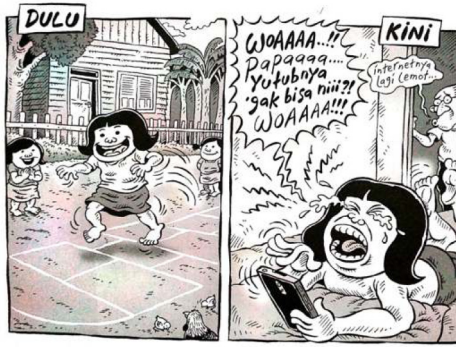
Gambar 6. Strip komik berjudul Dulu dan Sekarang

Stereotip atau cap Orang Indonesia juga terdapat dalam strip komik “Dulu” dan “Kini”. Dalam panel “Dulu”, istilah Dulu adalah ruang dan waktu yang diharapkan dan diekspektasikan indah oleh aktor dan pembaca. Sedangkan “Kini” ruang dan waktu masa kini yang tidak diharapkan. Hal tersebut mengkonstruksi sebuah wacana bahwa ruang dan waktu Dulu lebih baik daripada sekarang. Anak-anak yang bermain di luarrumah adalah sesuatu yang dianggap ideal. Sedangkan anak-anak yang bermain gawai dalam ‘Kini’ adalah sesuatu yang dianggap tidak ideal.