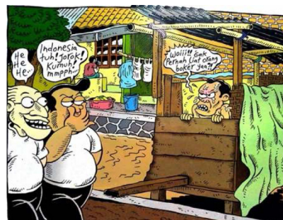
Gambar 15. Halaman pembuka kedua strip komik Indonesia Banget! 2

Sumber Daya : Panel Komik Halaman Pembuka Kedua Strip Komik