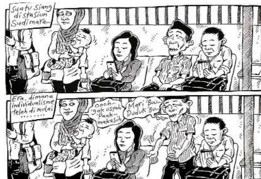
Gambar 20. Halaman 47 strip komik Indonesia Banget! 2

Sumber daya: Halaman 47 Strip Komik Indonesia Banget! 2