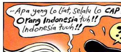
Gambar 5. Balon kata yang menyatakan cap Orang Indonesia

dalam strip komik juga dipahami melau-tui anatomi wacana dalam strip komik. Seperti halnya dalam panel pertama yang menggambarkan orang Indonesia sebagai representasi ketidakpedulian terhadap lalu lintas. Aturan lalu lintas menyebutkan adanya wacana larangan berkendara menggunakan telepon pin-tar. Ungkapan "Orang Indonesia itu" menunjukkan kecenderungan aktor yang negatif. Makna negatif adalah ak-tor yang melanggar wacana mengenai berlalu lintas dengan benar.