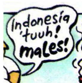
Gambar 2. Balon kata dengan penekanan pada penebalan kata (bold)

Ucapan dalam balon kata tersebut digambarkan secara berulang-ulang dalam panel pembuka. Terdapat enam balon kata yang menggambarkan dialog tokoh Leon yang diucapkan secara berulang-ulang. Beberapa panel diantaranya mengucapkan secara jelas wacana apa diungkapkan dalam strip komik. Seperti pada gambar 3 yaitu balon kata berisi “Indonesia ‘tuuh! Males!’” yang diucapkan oleh Leon. Ucapan Leon dalam balon kata tersebut mengkonstruksi bahwa (orang) Indonesia itu memiliki sifat pemalas. Dalam panel lain, Leon juga mengucapkan komentarnya mengenai orang Indonesia yang ditulis dengan metonimi ‘Indonesia’.