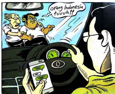
Gambar 4. Panel pertama halaman pembuka pertama strip komik Indonesia Banget! 2

Dalam panel tersebut, secara jelas Leon mengucapkan bahwa Indonesia jorok dan kumuh. Hal tersebut diper-tegas lagi dengan adanya penebalan dalam tanda baca setelah jorok dan kumuh. Selain penggambaran sifat secara langsung, dalam panel halaman pem-buka, Leon mengucapkan kembali dalam balon kata "...Dasar Orang Indonesia!". Perkataan tersebut merupakan wacana mengenai "Orang Indonesia" yang gemar bergosip.