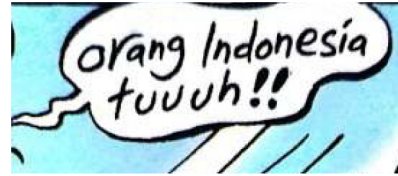
Gambar 1. Balon kata dengan penekanan pada tanda baca

dalamnya terdapat aspek parabahasa, yaitu penekanan. Penekanan yang terdapat di dalamnya berupa tanda baca dan penebalan huruf.