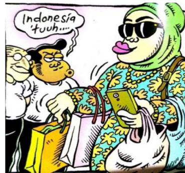
Gambar 12. Panel kedua halaman pembuka strip komik Indonesia Banget! 2

Sumber daya: Panel Kedua Halaman Pembuka Pertama