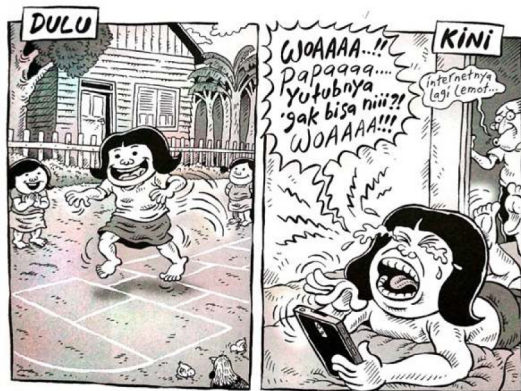
Gambar 18. Halaman 15 strip komik Indonesia Banget! 2