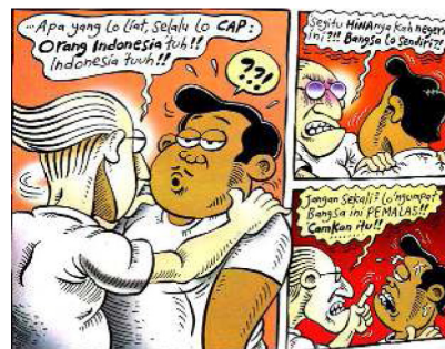
Gambar 16. Halaman pembuka keempat strip komik Indonesia Banget! 2

Sumber Daya: Panel Pertama, Kedua, dan Ketiga Halaman Pembuka Keempat