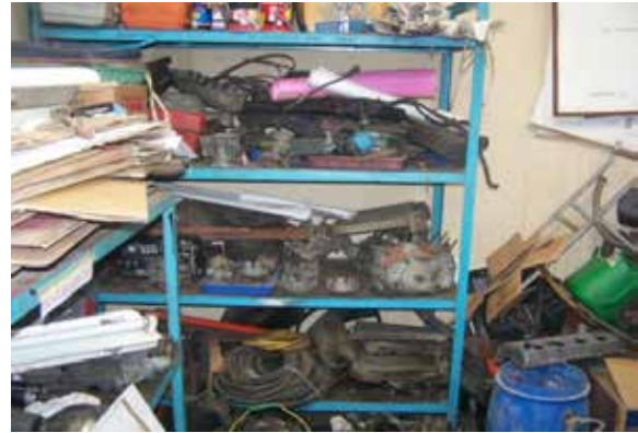
Gambar 3. Contoh Kasus Penanganan Bahan yang buruk