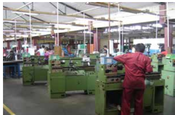
Gambar 4. Contoh Kasus Desain Tempat Kerja yang Baik

Agar diperoleh kajian yang runtut maka pembahasan mengacu kepada dua hal, pertama tentang objek kajian penelitian yang meliputi 9 jenis risiko bahaya di bengkel/laboratorium, yang kedua mengacu pada empat rumusan masalah penelitian. Berikut ini bahasan dimulai dari risiko bahaya dari pekerjaan yang terdapat di bengkel/laboratorium SMK.