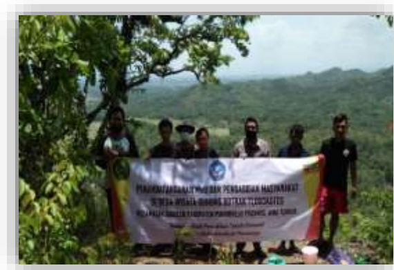
Gambar 1. Survei awal di Gunung Buthak Desa Tlogokotes

Kondisi Gunung Buthak hingga saat ini (awal Agustus 2021 masih terlalu alami, dalam arti belum terlihat adanya campur tangan manusia (baca: masyarakat Desa Tlogokotes) yang dilakukan secara serius di sisi mana pun gunung tersebut (lihat Gambar 1). Hanya ada jalan setapak yang tampaknya biasa dilalui oleh beberapa orang yang mengunjungi kebun di kaki gunung Buthak atau yang kebetulan terletak di sekitar gunung tersebut. Dari arah sebelah timur, jalan setapak yang ada terlalu sempit dan cukup berbahaya untuk dilewati karena tidak ada pagar disisi jalan yang mengarah ke jurang. Jalan setapak tersebut mengarah ke punggung kiri Gunung Buthak. Sementara lereng sebelah utaranya, jika pendakian ditempuh melalui jalan di depan sebuah mushola yang tak jauh dari gerbang yang mengarah ke Gunung Buthak, jalan setapak menuju puncak sama sekali tidak terlihat ketika musim hujan. Pendakian yang ketika itu dilakukan oleh tim pengabdian kepada masyarakat Universitas Muhammadiyah Purworejo dan 6 mahasiswa, yaitu: pada bulan September 2021 harus berjuang dengan susah payah memanjat tebing yang curam mengingat di tebing tertentu dibagian ini tidak dijumpai pepohonan baik kecil atau pun besar untuk dijadikan sebagai sarana untuk berpegangan, selain batang kecil perdu yang sudah tampak mengering yang kadang berduri. Akibatnya, harus berjalan menyamping secara zig-zag semata-mata agar dapat sedikit demi sedikit naik menuju puncak, di samping terpaksa menerobos tanaman berduri.