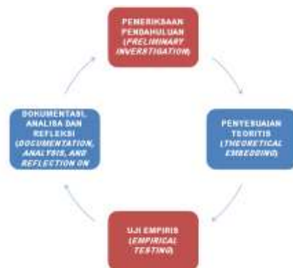
Gambar 3. Alur pelaksanaan Kegiatan Pengabdian

Data pengukuran kegiatan pengabdian diperoleh secara langsung dari responden. Untuk memperoleh sejumlah data yang diharapkan, digunakan instrumen pengumpulan data dengan quisioner. Alur pelaksanaan kegiatan pengabdian dapat dilihat pada Gambar 3.