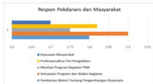
Gambar 8. Hasil Kuesioner Tanggapan Masyarakat

Tlogokotes, untuk melihat sejauh mana respon pokdarwis dan masyarakat terhadap kegiatan yang dilakukan (lihat Gambar 8).