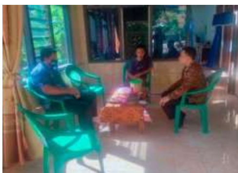
Gambar 4. Observasi dan Koordinasi dengan Pokdarwis

Pelaksanaan kegiatan pengabdian kepada masyarakat yang dilakukan di Obyek Wisata Gunung Buthak Desa Tlogokotes Kecamatan Bagelen Provinsi Jawa Tengah sejak 6 Agustus 2021 sampai dengan 28 Oktober 2021. Permasalahan prioritas yang disurvei dari interview ke warga sekitar gunung buthak desa tlogokotes dan observasi yang dilakukan bersama pengelola kelompok sadar wisata (pokdarwis) dan analisis kebutuhan yang mendesak. Agenda pelaksanaan selanjutnya yang dilakukan tim pengabdian yaitu merencanakan program dan implementasi program penerapan teknologi tepat guna bagi kawasan gunung buthak. Gambar 4 merupakan koordinasi pemantapan program penerapan panel sel surya di kawasan obyek wisata gunung buthak.