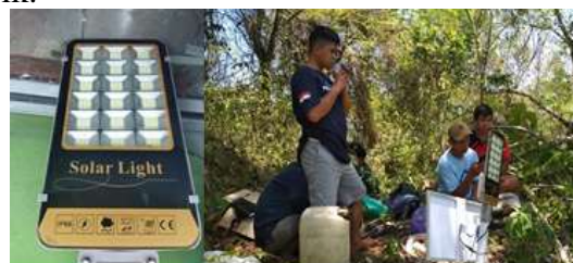
Gambar 6. Proses Perakitan Panel Sel Surya

Listrik dari Teknology panas surya atau matahari bisa juga didapati dengan cara membuat listrik tenaga surya sederhana dan bias dilakukan mandiri oleh siapa saja yang mau mencoba untuk berkreasi dengan teknologi. Gambar 6 menunjukkan proses pembuatan solar cel lampu listrik.