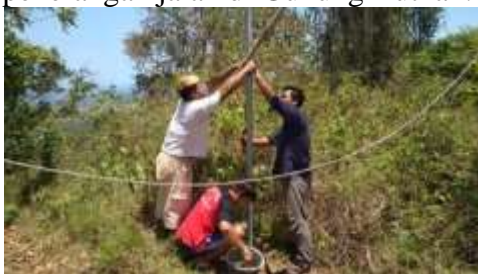
Gambar 7. Pemasangan Solar Cell untuk Penerangan Jalan di Gunung Buthak

Bentuk gelombang ini tidak ideal dan dalam banyak kasus dapat merusak peralatan elektronik rumah tangga. Inverter modified sine wave mempunyai gelombang yang dimodifikasi mendekati bentuk sinus. Untuk menghindari losses listrik yang besar, SHS yang saya pasang menggunakan sistem solar controller 24 volt, bukan 12 volt. Supaya tegangannya mencukupi untuk pengisian aki, maka panel surya harus diseri. Dua kali dua ( 2 \times 2 ) panel 100 Wp diseri menghasilkan tegangan 36 volt dan arus maksimum 2 \times 5,8 A, kemudian dua kali panel 50 Wp juga diseri menghasilkan tegangan 36 volt dan arus maksimum 3A. Dua rangkaian tersebut kemudian diparalel sehingga diperoleh panel surya total 36 volt dan arus maksimum 14,6 A. Untuk panel surya saya pilih yang tipe monokristalin karena kompleks daerah perumahan yang berada di sekitar pegunungan dimana ada beberapa halangan sinar matahari yang cukup berarti. Sehingga tipe monokristalin ini akan memberikan efisiensi energi yang lebih baik khususnya dalam pembuatan lampu penerangan jalan dikawasan obyek wisata Gunung Buthak Desa Tlogokotes. Gambar 7 menunjukkan pemasangan solar cell untuk penerangan jalan di Gunung Buthak.