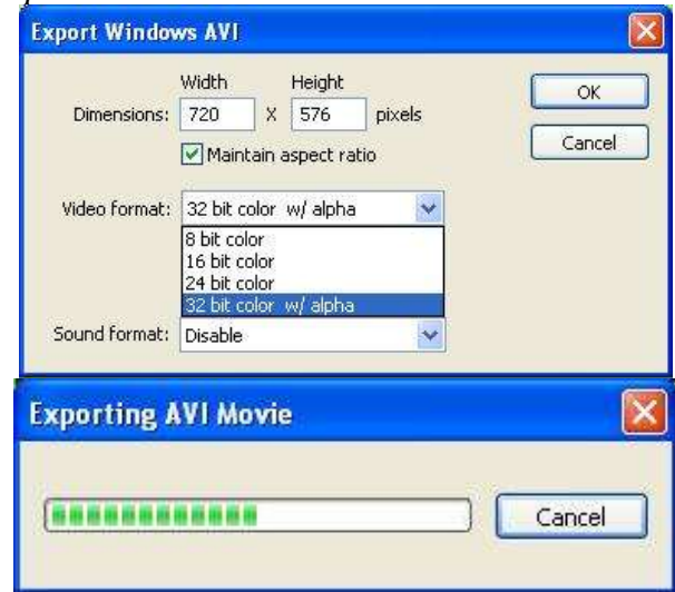
Gambar 7. Export windows AVI