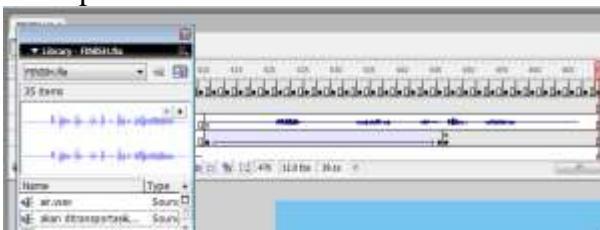
Gambar 5. Drag and drop audio ke timeline.

Setelah audio masuk ke library, kemudian drag and drop ke timeline.