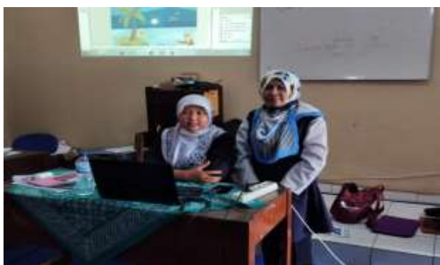
Gambar 9. Tim Pengabdian