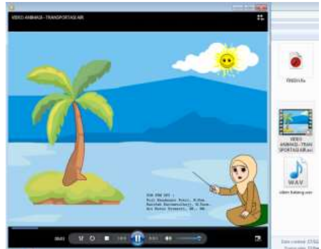
Gambar 8. Video Animasi .avi

Pendampingan keempat tentang pembuatan channel YouTube, upload video animasi ke YouTube, copi link video animasi . Pendampingan keempat tentang pembuatan channel YouTube, upload video animasi ke YouTube, copi link video animasi . Setiap peserta (guru) praktek pembuatan video animasi bertemakan materi pelajaran IPA yaitu transportasi air sebagai sample tema dalam pengabdian. Adapun copi link video animasi , https://www.youtube.com/watch?v=yZP6Pg3h_Fk