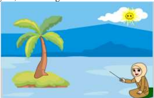
Gambar 2. Pembuatan objek

Pengenalan teknik pembuatan objek. Pembuatan objek pemandangan alam, sebuah pohon, karakter bu guru, matahari .gif