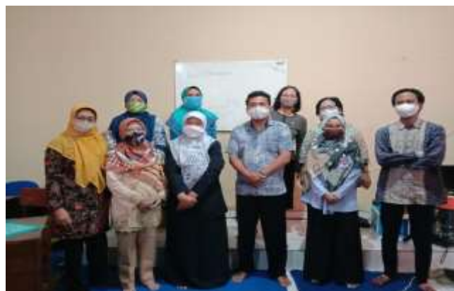
Gambar 11. Menjalin Kerjasama dengan Mitra (Guru Mata Pelajaran)