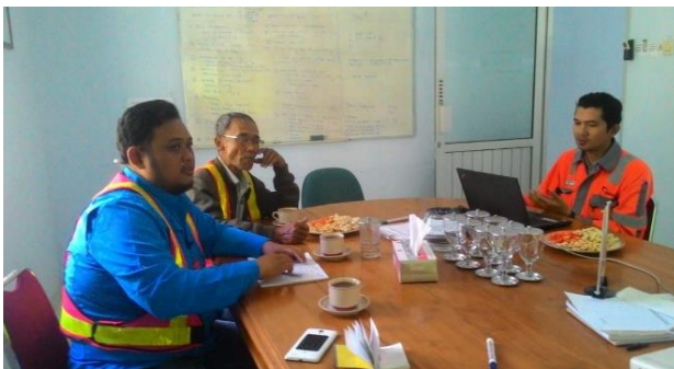
Gambar 1 diskusi dengan mitra

Pengukuran mikroseismik dilakukan selama 5 hari dengan durasi pengukuran 30 menit di masing-masing titik yang berjarak kurang lebih 1 km. Gambar 2 foto alat Seismograph, gambar 3 foto kegiatan pengukuran dan pengambilan data lapangan.