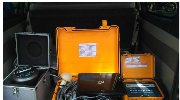
Gambar 2 alat seismograph