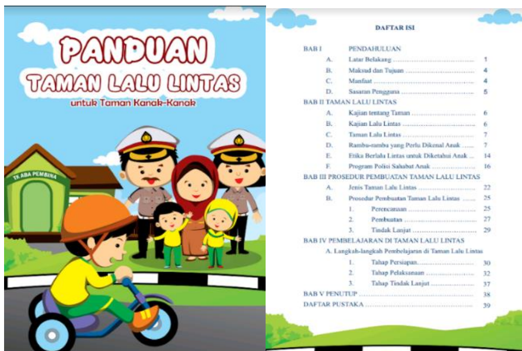
Gambar 2. Tampilan buku panduan taman lalu lintas

Pengembangan pembelajaran di taman lalu lintas berdasarkan hasil diskusi dengan para ahli kurikulum, pendidikan anak usia dini, dan pihak kepolisian, serta para guru. Dari hasil diskusi tersebut diperoleh kesimpulan bahwa pembelajaran di taman lalu lintas tidak hanya dapat dilakukan pada saat tema pekerjaan polisi namun dapat pula dikembangkan pada tema-tema lain. Seperti tema diri sendiri, transportasi, kesehatan dan keselamatan, lingkunganku, kebutuhanku, dan rekreasi. Tema-tema itu kemudian dirancang untuk dapat digunakan dalam pembelajaran di taman lalu lintas. Berikut ini contoh struktur buku panduan yang dikembangkan dalam penelitian ini.