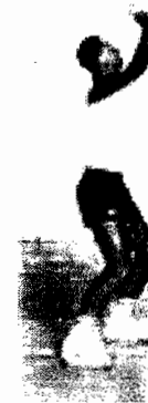
Gambar 1. Sikap permulaan dalam teknik pass atas

Teknik pass atas dalam melakukan gerakannya dapat digambarkan secara bertahap yaitu dari tiga sikap permulaan, sikap perkenaan, dan sikap akhir perkenaan. Sikap permulaan dalam teknik pas atas adalah pemain mengambil sikap siap normal dalam permainan bola voli, dimana memudahkan pengumpan bergerak ke arah yang diinginkan. Pemain berdiri dengan salah satu kaki berada di depan kaki yang lain, bila kidal kaki kiri berada lebih ke depan dari kaki kanan. Posisi lutut ditekuk, badan agak condong sedikit ke depan dengan tangan siap berada di depan dada. Pada saat akan melakukan umpan atau pas atas, segeralah menempatkan diri dibawah bola dan tangan diangkat ke atas depan kira-kira setinggi dahi, jari-jari tangan secara keseluruhan membentuk setengah lingkaran atau bulatan sebesar bola voli dan jari-jari dalam keadaan merenggang serta kedua ibu jari membentuk satu sudut V terbalik.