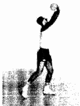
Gambar 2. Perkenaan bola pada teknik pass atas

terutama ruas pertama dari ibu jari. Pada saat jari bersentuhan atau disentuh bola keadaan jari-jari agak di tegangkan sedikit dan saat itu juga di ikuti gerakan pergelangan lengan kearah depan atas agak eksplosif.