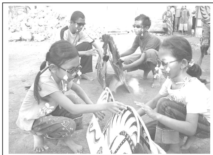
Gambar 4 Rancangan Koreografi pada Proses Berdiri dari Posisi Jengkeng

motif jilig ke depan dalam 4x8 hit . Kedua tangan ke samping (tangan kanan lurus ke kanan, tangan kiri lurus ke kiri) kepala coklekan kanan kiri 4x8 hit . Mengambil kacamata (2x8 hit ) dipakai, gerak kepala coklekan 4x8 hit . e) Berdiri, jalan mipil (posisi kaki kanan di depan, kaki kiri belakang) membuat lingkaran kecil (tiga buah). Jalan berpasangan 1x8 hit , saling berhadapan. Kaki kanan angkat ke depan disentuh kaki kanan pasangannya, mundur kaki kanan gedrug kaki kiri 4x8 hit . Posisi kaki ditempat entrakan . f) Gerak awe- awe 4 hit (delapan kali) bergantian tangan kanan kiri. Jalan membuat pola lantai garis lurus.