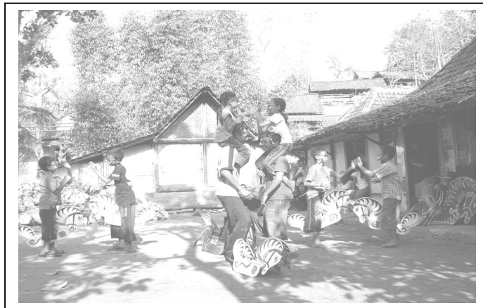
Gambar 5 Implementasi Tindakan siklus 2 gerak memanggul

j) Dua pemain (A) berhadapan tepuk tangan, pemain background duduk melingkar sambil tepuk tangan memberikan semangat. Gerak di tempat berhadapan dolanan asta , gerak di tempat lonthangan . Maju di depan kuda kepang, gerak di tempat ganti arah hadap. Melingkari kuda ( gedrug kaki kanan, kaki kiri mipil ). k) Ambil kuda bersama-sama, jalan mipil (dua tangan memegang kuda) membentuk formasi 4 baris, jalan ke depan serempak dengan variasi gerak bahu, mundur serempak dengan variasi gerak bahu, setiap gerak bahu diikuti teriakan “ ya..ya..yaaa ”. Jalan mipil membentuk lingkaran besar, berbaris. Selesai.