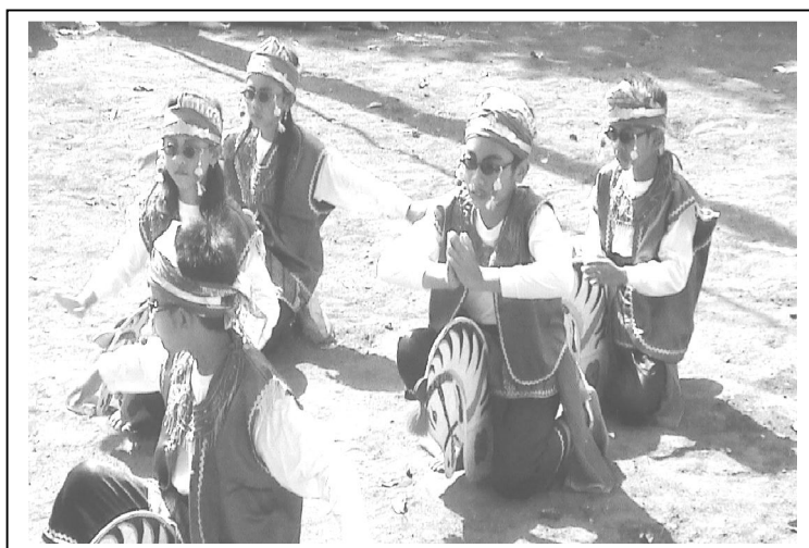
Gambar 7 Rancangan Koreografi yang Dipentaskan dalam Acara Bersih Desa

Hasil penelitian menunjukkan pemain menguasai sebelas motif gerak pokok sesuai irama dan hafal gerakannya. Selain dapat melakukan gerakan secara rampak, ekspresi/penjiwaan dapat dilakukan terutama pada sikap menari, jalan mipil , dan berada di atas bahu dua penari lain.