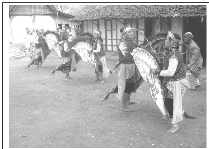
Gambar 2 Observasi Penyajian Reog "Kaloka" Putri