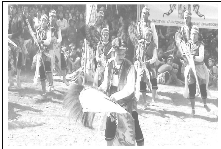
Gambar 1 Pementasan Kesenian Reog Kaloka dalam Acara Bersih Desa

Permasalahan penelitian ini dirumuskan sebagai berikut: Bagaimanakah proses perancangan koreografi anak dilakukan melalui revitalisasi seni tradisional reog "KALOKA"?