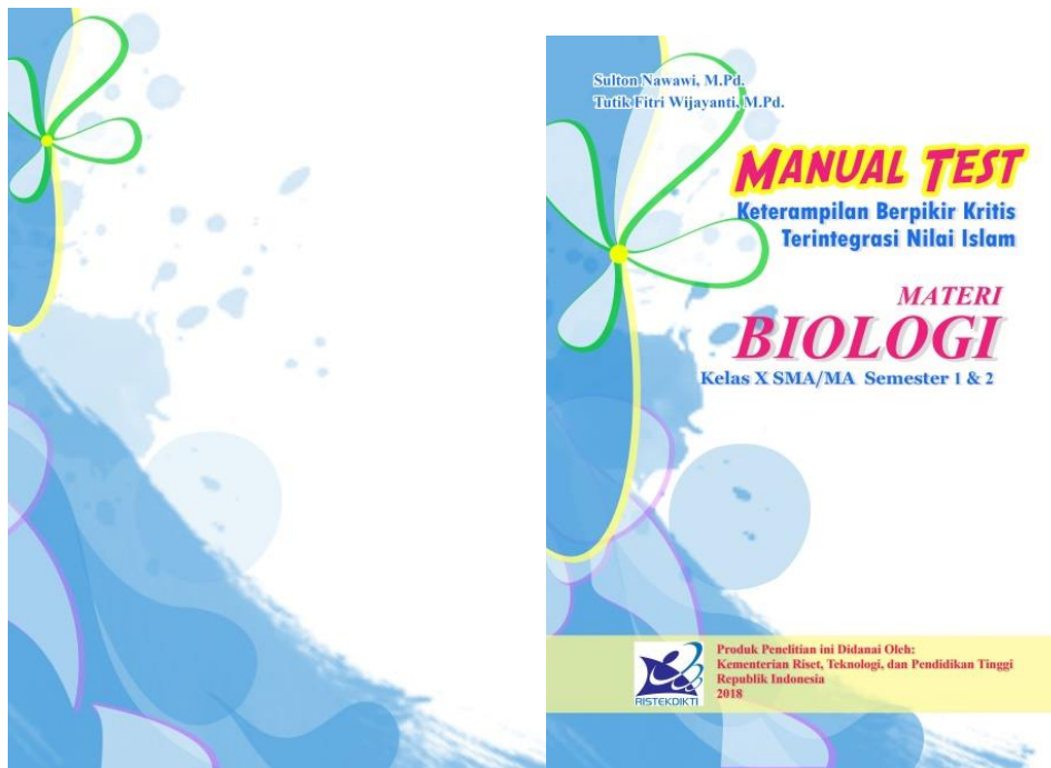
Gambar 3. Cover Produk Instrumen Tes Biologi Berbasis Keterampilan Berpikir Kritis Terintegrasi Nilai Islam

Setelah validasi lengkap, maka selanjutnya membuat norma acuan dari distribusi skor tes. Perolehan skor yang diperoleh dapat digunakan untuk melihat tingkat keterampilan berpikir kritis terintegrasi nilai Islam pada siswa. Norma acuan bisa dilihat pada Tabel 17.