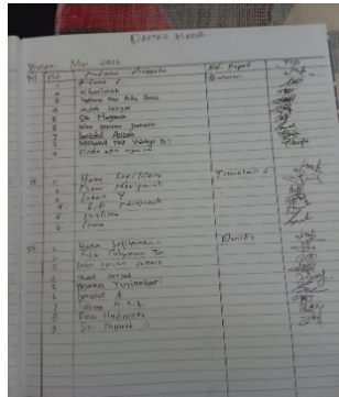
Gambar 2. Daftar Hadir Rapat Anggota (Koperasi Mahasiswa Amanah, 2023)

menghadiri rapat dan menyampaikan ide-ide, gagasan atau pandangan yang dapat berkontribusi positif di koperasi. Seperti pada gambar berikut.