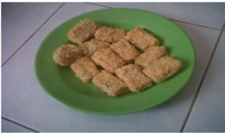
Gambar 1. Nugget Belut