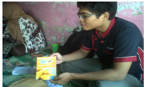
Gambar 2. Materi Pengemasan