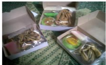
Gambar 3. Kripiq Belut