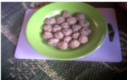
Gambar 4. Bakso Belut