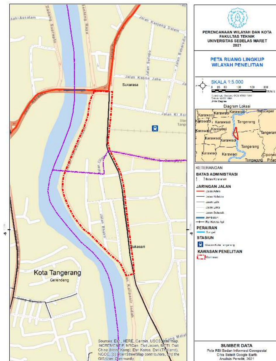
Gambar 1. Peta Deliniasi Kawasan Pecinan Kota Lama Tangerang

kemudian dianalisis secara deskriptif kualitatif. Adapun analisis dalam penelitian ini terdiri dari analisis jaringan jalan dan pergerakan, analisis sirkulasi kendaraan, analisis pergerakan transit, analisis sistem parkir, dan analisis jalur pejalan kaki dan jalur sepeda. Analisis dilakukan melalui deskripsi data, menganalisis kondisi, penyebab, dan permasalahan yang terjadi, sehingga dapat disimpulkan saran yang sesuai untuk pengembangan sirkulasi dan jalur penghubung Kawasan Pecinan Kota Lama Tangerang.