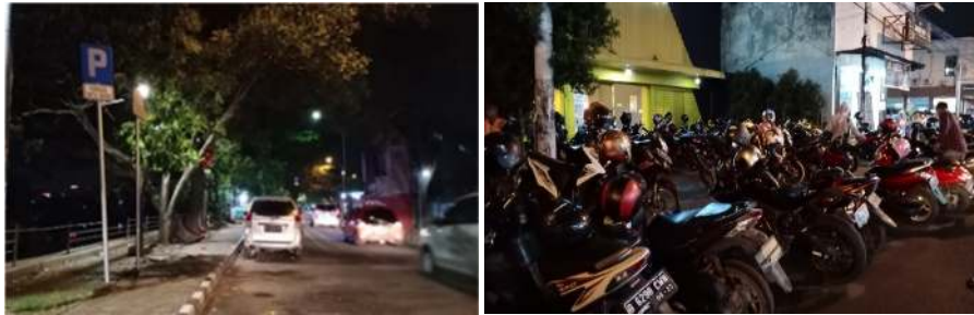
Gambar 8. Kondisi Eksisting Sistem Parkir di Jalan Kalipasir Indah

Gambar 8 dan Gambar 9 menunjukkan kondisi sistem parkir di Kawasan Pecinan Kota Lama Tangerang. On street parking terjadi karena keterbatasan lahan di dalam kawasan, sedangkan jumlah pengguna atau pengunjung cenderung tinggi mengingat kawasan tersebut juga sebagai kawasan wisata.