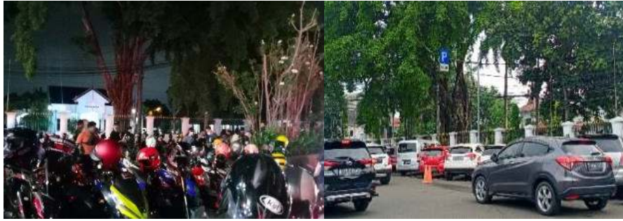
Gambar 7. Kondisi Eksisting Sistem Parkir di Jalan Kisamaun