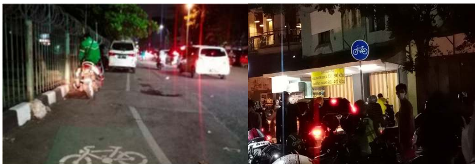
Gambar 9. Kondisi Eksisting Jalur Sepeda di Kawasan Pecinan Kota Lama Tangerang

Sedangkan pada zona ruang terbuka yang berada di tepi sungai Cisadane, telah tersedia jalur pejalan kaki yang digunakan oleh masyarakat untuk berjalan-jalan serta menikmati pemandangan Sungai Cisadane di sepanjang jalur tersebut. Jalur pejalan kaki tersebut juga dilengkapi oleh pepohonan yang rindang sehingga menambah kenyamanan bagi pejalan kaki. Namun, pada jalur ini belum dilengkapi oleh street furniture yang memadai dan dapat menambah aktivitas masyarakat. Hal tersebut tentu juga akan berpengaruh pada kenyamanan pejalan kaki yang menggunakan jalur tersebut.