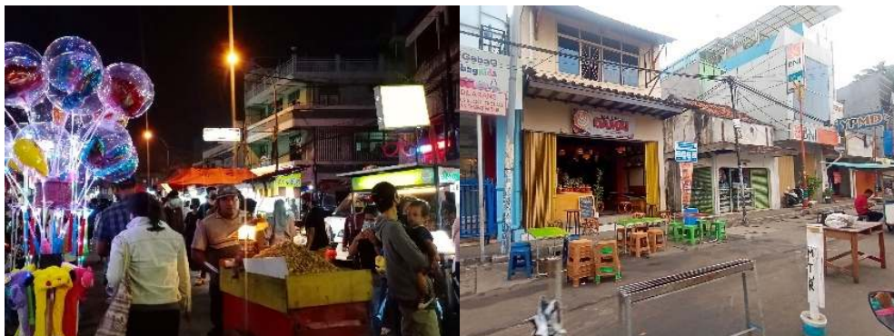
Gambar 12. Kondisi Eksisting Jalur Pejalan Kaki di Zona Kuliner