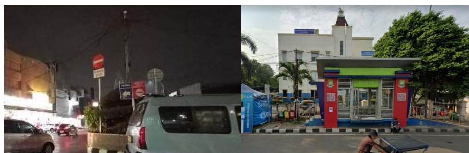
Gambar 5. Titik Pergerakan Transit Kawasan Pecinan Kota Lama Tangerang