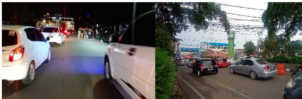
Gambar 3. Kondisi Eksisting Sirkulasi Kawasan Pecinan Kota Lama Tangerang