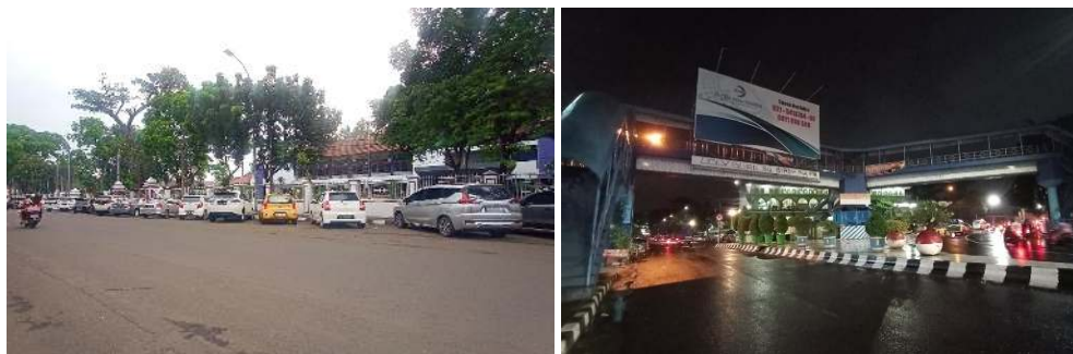
Gambar 2. Kondisi Eksisting Jalan Kolektor Sekunder Jalan Kisamaun

Sirkulasi kota meliputi prasarana jalan yang tersedia, bentuk struktur kota, fasilitas pelayanan umum, dan jumlah kendaraan bermotor yang semakin meningkat. Sirkulasi kendaraan di Kawasan Pecinan Kota Lama Tangerang terbilang cukup lancar pada saat weekday atau hari kerja. Kemacetan di kawasan ini menjadi permasalahan utama pada saat weekend atau akhir pekan/masa libur. Kemacetan disebabkan karena adanya pedagang kaki lima (PKL) yang beroperasi dan adanya on street parking di ruas Jalan Kisamaun sehingga menyebabkan terganggunya sirkulasi kendaraan di Kawasan Pecinan Pasar Lama Kota Tangerang. Akses ke dalam kawasan pecinan cukup mudah, karena letaknya berada di pusat Kota Tangerang.