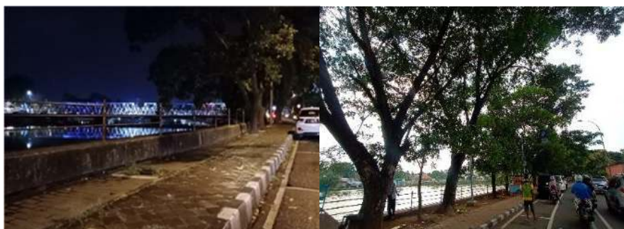
Gambar 14. Kondisi Eksisting Jalur Pejalan Kaki