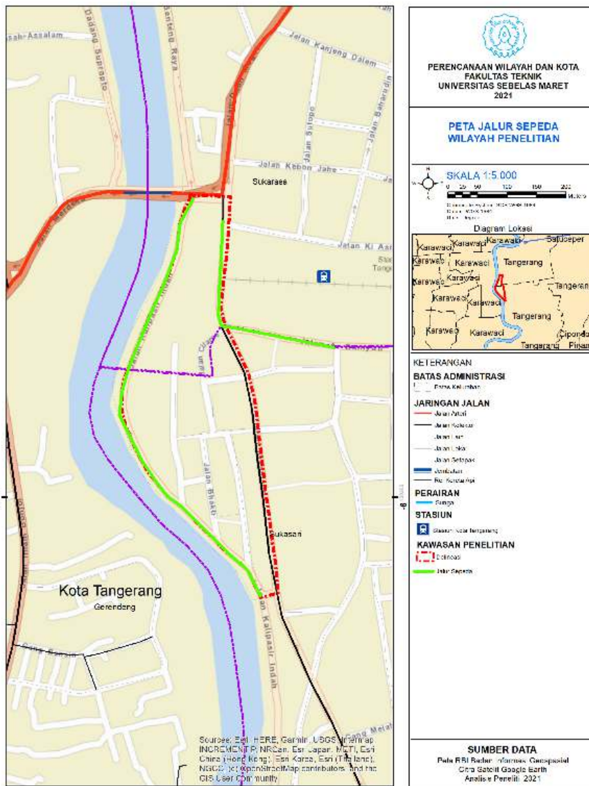
Gambar 13. Peta Jalur Sepeda Kawasan Pecinan Kota Lama Tangerang