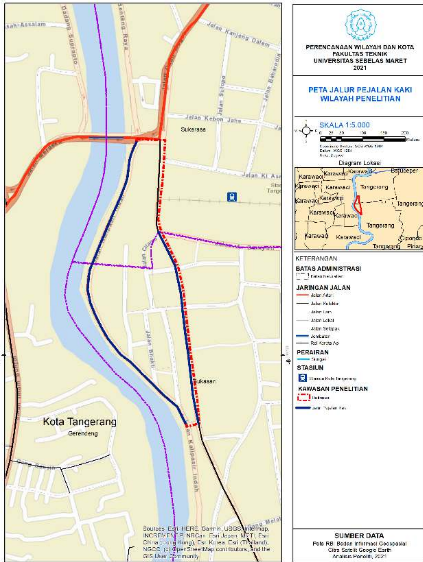
Gambar 11. Peta Jalur Pejalan Kaki Kawasan Pecinan Kota Lama Tangerang