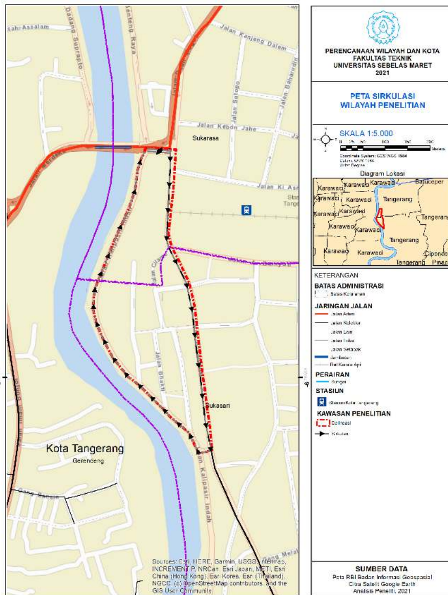
Gambar 4. Peta Sirkulasi Kawasan Pecinan Kota Lama Tangerang