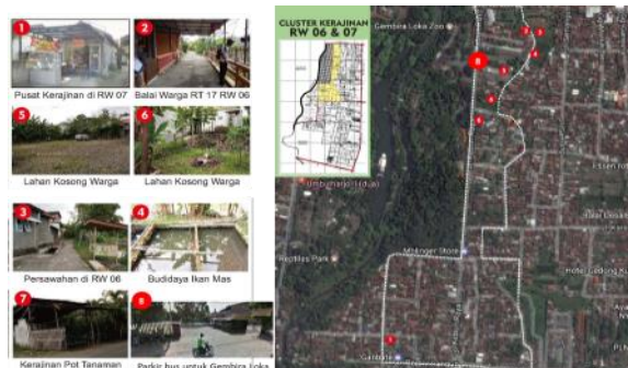
Gambar 5. Peta Potensi Klaster Kerajinan