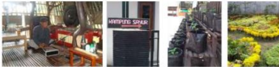
Gambar 1. Kegiatan Budaya dan Wisata Agro di Kampung Wisata Rejowinangun

Prinsip pengembangan desa/kampung wisata adalah sebagai salah satu produk wisata alternatif yang dapat memberikan dorongan bagi pembangunan kawasan yang berkerlanjutan serta memiliki prinsip-prinsip pengelolaan (Bappeda, 2013). Seiring dengan perkembangannya, muncul konsep ekowisata berbasis masyarakat, yaitu konsep wisata yang menyuguhkan sumber daya alam wilayah dan budaya setempat yang memiliki nilai konservasi serta mampu meningkatkan pendapatan ekonomi bagi masyarakat.