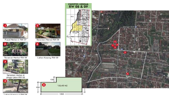
Gambar 7. Peta Potensi Klaster Herbal

memproduksi aneka jamu tradisional secara alami. Produk jamu ini juga sudah menjadi produk unggulan beberapa hotel berbintang di Yogyakarta.