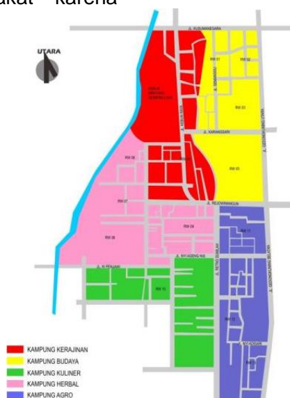
Gambar 2. Peta pembagian Klaster di Kelurahan Rejowinangun

memiliki potensi wisata alam dan budaya yang beragam.