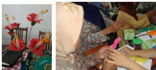
Gambar 6. Hasil Klaster Kerajinan