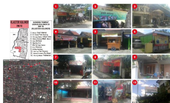
Gambar 8. Peta Potensi Klaster Kuliner

bersertifikasi dari BPOM. Ibu ibu penggerak klaster kuliner juga telah secara rutin menggelar pasar jajanan untuk berbuka puasa setiap bulan puasa.