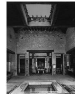
Gambar 4. Atrium dan Impluvium

Rumah bangsa Romawi memiliki interior yang mengikuti pola umum yang berlaku saat itu, yang dibagi menjadi beberapa bagian, yakni atrium sebagai central hall di dalam rumah yang memiliki bukaan atap berukuran besar (disebut compluvium ) dimana sinar matahari dapat masuk untuk menerangi bagian dalam rumah dan air hujan dibiarkan masuk yang kemudian ditangkap oleh kolam yang terletak dibagian tengah ruang (disebut impluvium ). Tamu memasuki atrium melalui selasar yang biasanya berhiaskan mozaik pada lantainya. Tablium merupakan ruang suci yang terletak di ujung atrium . (Wealle, 1982:207).