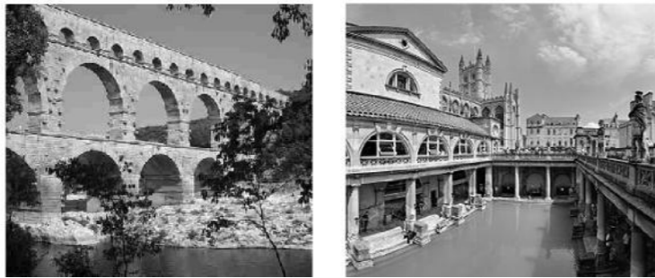
Gambar 2. Aquaduct dan Thermae

Kemajuan Romawi di bidang interior dan arsitektur selain dapat dilihat dari kemegahan dan kemewahan bangunan-bangunannya juga dari sistem peratapannya yang sangat hebat, merupakan kombinasi antara lengkung sejati ( true vault ) dan lengkung silang ( cross barrel vault ). Struktur cross vault yang dimulai di jaman Romawi berbuah luar biasa di jaman Gotik. Karena kehebatan konstruksinya, gereja Gotik berani membuka clerestory ber dinding kaca sehingga menjadi terang.