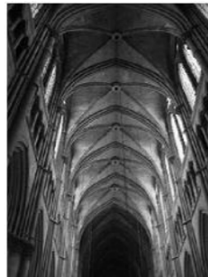
Gambar 3. Clerestory Cathedral Rheims

Kemajuan Romawi di bidang interior dan arsitektur selain dapat dilihat dari kemegahan dan kemewahan bangunan-bangunannya juga dari sistem peratapannya yang sangat hebat, merupakan kombinasi antara lengkung sejati ( true vault ) dan lengkung silang ( cross barrel vault ). Struktur cross vault yang dimulai di jaman Romawi berbuah luar biasa di jaman Gotik. Karena kehebatan konstruksinya, gereja Gotik berani membuka clerestory ber dinding kaca sehingga menjadi terang.