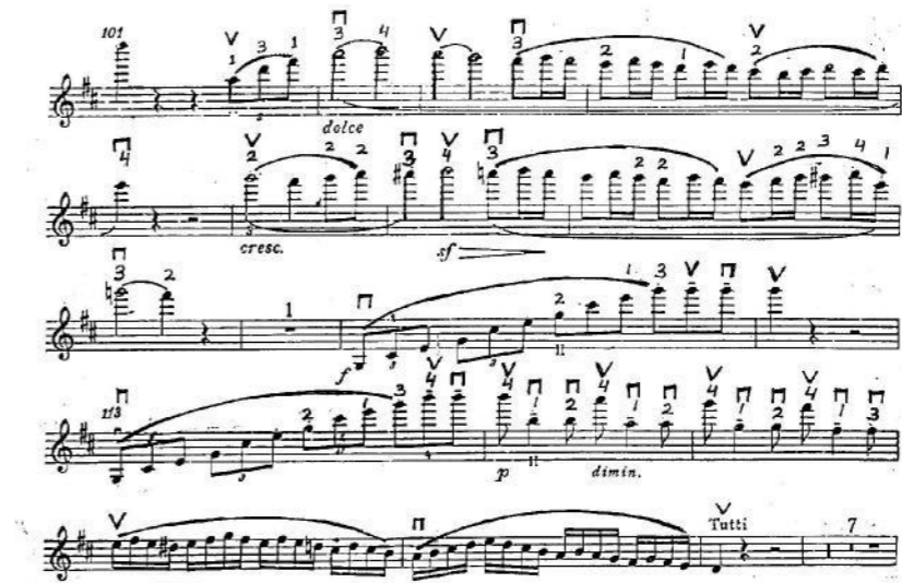
Notasi 4. versi Szeryng

Zino dalam frase yang sama menggunakan perpindahan posisi dengan penjarian 1-1-3-4, jari 1 berpindah secara halus tanpa menimbulkan efek glissando (nada yang menyeret) di birama 101. Menyadari sedang diiringi dengan orkestra lengkap yang terdiri dari berbagai macam alat musik, Zino melakukan permainan bowing yang berbeda dengan Szeryng dimana lebih banyak mengganti arah gesekan (penggunaan legato yang lebih pendek) sehingga produksi suara yang dihasilkan lebih sonor (nyaring) dan solis biola tidak tertutup suaranya oleh iringan orkestra. Perbandingan bowing dan fingering antara Szeryng dan Zino :