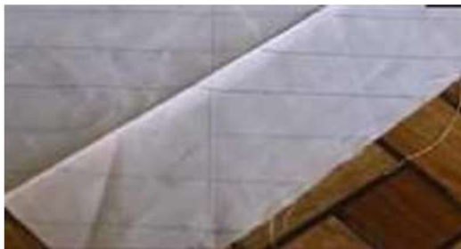
Gambar 8 Proses Membuat Garis Diagonal

Ketiga , membuat garis kotak/belah ketupat dimulai dari garis diagonal (Gambar 8). Proses ini dilakukan secara berulang