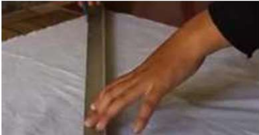
Gambar 7 Proses Membuat Garis pada Kain