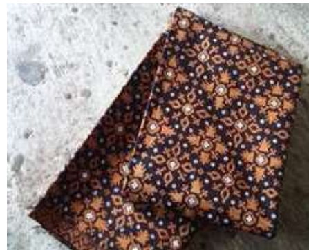
Gambar 3 Batik Nitik Joyokusumo