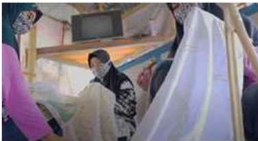
Gambar 4 Kegiatan Membatik Bersama

Adapun Indikasi Geografis ialah pemberian pengakuan ataupun ciri wilayah asal suatu karya seni ataupun produk yang didukung dengan aspek lingkungan geografis semacam faktor alam, faktor orang ataupun