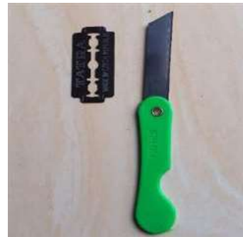
Gambar 9 Cutter Kecil dan Pisau Seset

perlahan agak menyamping dengan menggunakan pisau silet. Alat yang digunakan dalam membuat canting klowong adalah cutter kecil dan pisau seset (Gambar 9). Canting cawang pada dasarnya merupakan canting Tembok, klowong, dan isen yang di bagian ujungnya dibelah menjadi empat seperti bunga agar hasil malam yang keluar dapat berbentuk belah ketupat. Contoh proses pembuatan canting cawang yang dilakukan oleh Ibu Aminah (Gambar 10 & 11). Setelah ujung canting terbagi menjadi empat, langkah selanjutnya mulai menarik empat bagian tersebut ke arah yang berlawanan hingga membentuk seperti bunga Gambar 12.