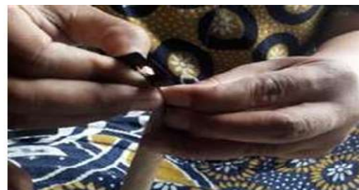
Gambar 10 Proses Membagi 4 Sisi Menggunakan Pisau Cutter