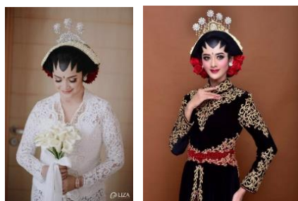
Gambar 11. Busana Pengantin Jogja Sumber Gambar : Sanggar Liza [8]

Busana yang digunakan pada masa sekarang ini lebih sering menggunakan Kebaya modern, bukan bludru. Biasanya berwarna hitam atau putih