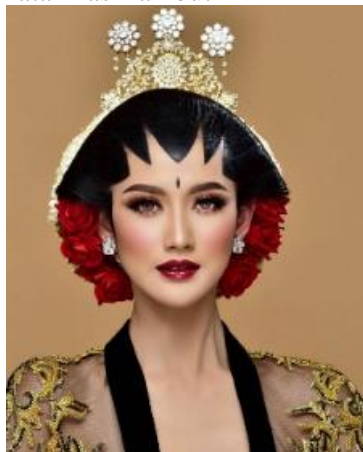
Gambar 10. Tata Rias Rambut Pengantin Jogja Sumber Gambar : Sanggar Liza [8]

Hiasan sanggul, atau perhiasan menghadap kedepan. Mungkin supaya terlihat menarik saat difoto. Cunduk mentul juga dihadapkan kedepan, jumlahnya tetap ganjil namun biasanya digunakan 3 atau 5.