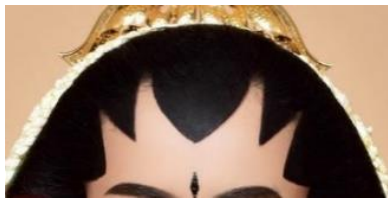
Gambar 3. Penitis

Ujung penitis pada riasan Jogja Putri selalu mengarah ke ujung hidung. Alasannya adalah penitis merupakan simbol bahwa segala sesuatu harus memiliki tujuan yang efektif. Termasuk dalam perkara keuangan rumah tangga.