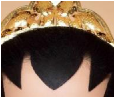
Gambar 2. Pengapit

Pengapit dimaksudkan untuk mengendalikan penunggal agar tetap pada posisi tengah. Ini bermakna bagaimana pun kehidupan rumah tangga yang mudah goyah ke sana kemari, pengapit harus tetap menjaga agar tujuan utama pernikahan tetap pada jalan/garis yang lurus sesuai tujuannya yang mulia.