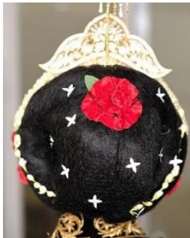
Gambar 7. Tata Rias Rambut Tampak Belakang Sumber Gambar : [8]

Sanggul yang digunakan adalah sanggul tekuk. Karena sanggul ini merupakan sanggul daerah yang berasal dari Daerah Istimewa Yogyakarta.