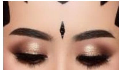
Gambar 5. Cithak

Berbentuk seperti berlian di dahi, dibuat dengan daun sirih yang digunting kemudian ditempelkan di kulit. Maknanya adalah seperti mata dewa Siwa sebagai dewa pengetahuan, yang mana diharapkan seorang wanita setelah menikah menjadi sosok cerdas, cemerlang, berilmu pengetahuan, serta berakhlak baik.