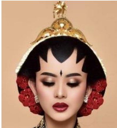
Gambar 6. Tata Rias Rambut Tampak Depan