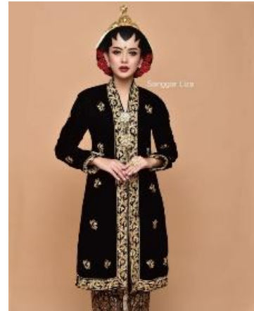
Gambar 8. Busana Putri Pengantin Jogja Putri

Busana yang digunakan pengantin yogyakarta puteri mempelai wanita mengenakan kebaya panjang berwarna hitam bludru dengan bordiran tanpa bef berwarna emas, kain batik motif sidoasih, sidomukti, atau simbar lintang, selop.