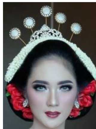
Gambar 9. Tata Rias Wajah Pengantin Jogja