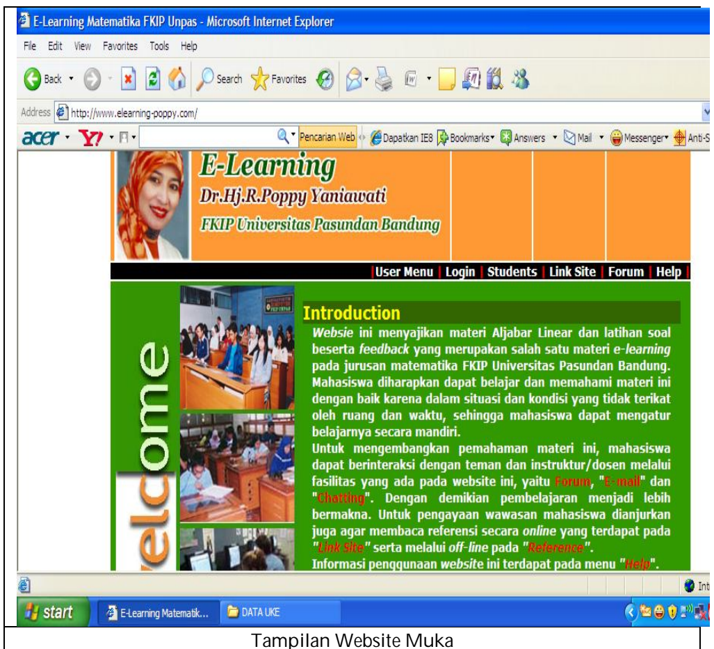
Gambar 1. Tampilan Web Site Muka E-Learning

learning lebih baik dibanding model pembelajaran lainnya, dan model full e-learning kurang baik dibanding model pembelajaran lainnya. Tidak terdapat perbedaan yang signifikan sikap mahasiswa terhadap e-learning matematika antara model full e-learning dan blended learning . Akan tetapi, pada perguruan tinggi level B, tidak terdapat perbedaan yang signifikan daya matematik mahasiswa di antara ketiga model pembelajaran tersebut.