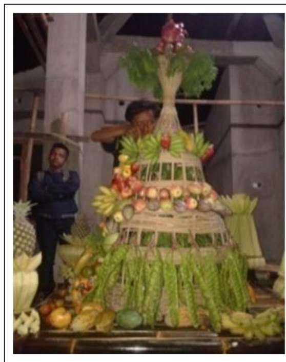
Gambar 4. Membuat Buceng Buah

Buceng buah dibuat menjadi dua bagian yaitu bagian bawah dan bagian atas. Pada bagian atas dipasang sosog yang dipasang bolak balik. Bagian bawah terdiri dari beberapa larik. Larik bawah ditata petai hingga mengelilingi ancakan . Larik atasnya ditata kakao, pepino dan apel. Larik berikutnya ditata terong, pisang, jambu monyet, mangga dan belimbing. Pada larik atas dipasang bawang. Sedangkan pada bagian atas yang