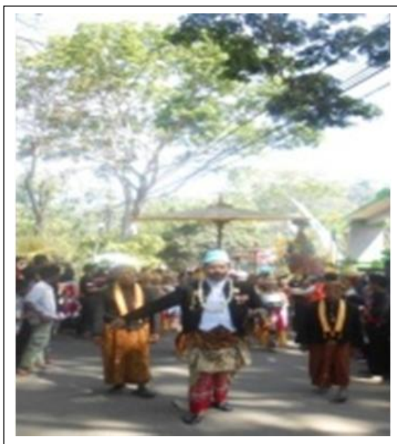
Gambar 7. Rombongan Pembawa Sesaji Memasuki Tempat Upacara

Dalam serah terima sesaji ini ada beberapa acara, yaitu diawali dengan pembukaan oleh Humas Protokoler Pemkab Ponorogo, dilanjutkan dengan laporan ketua panitia, sambutan bupati, serah terima sesaji dari subamanggala kepada bupati dilanjutkan dengan doa dan tari bedhaya (Gambar 8).