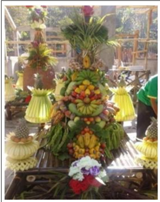
Gambar 5. Buceng Buah

sudah dipasang sosog bolak balik dipasang semangka, buah naga serta daun cemara. Di setiap pojok jodhang dipasang janur dengan tambahan tomat dan wortel diatas janur. Buceng buah yang sudah dihias seperti Gambar 5.