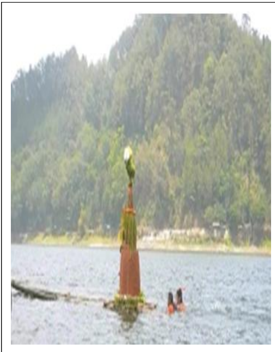
Gambar 10. Larungan Buceng Agung