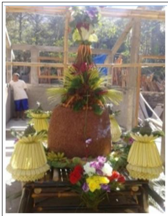
Gambar 3. Buceng Agung

agung yang sudah dihias seperti Gambar 3.