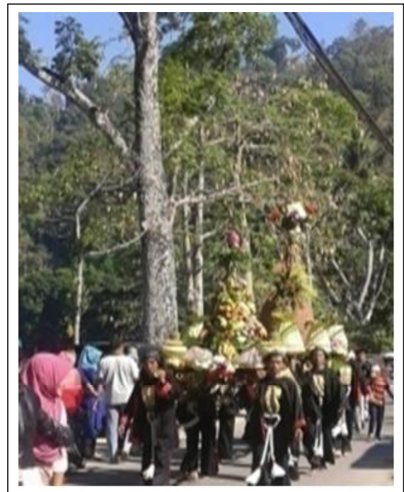
Gambar 6. Buceng Agung dan Buah Dibawa menuju Pendapa Kecamatan

Larungan buceng agung dilaksanakan pada hari Rabu tanggal 14 Oktober 2015. Pagi hari sebelum dimulainya upacara para panitia dan paraga mempersiapkan sesaji buceng agung dan buceng buah yang sudah dibuat pada malam harinya dibawa menuju Pendapa Kecamatan Ngebel untuk diistirahatkan sebentar sembari menunggu datangnya rombongan bupati (Gambar 6).