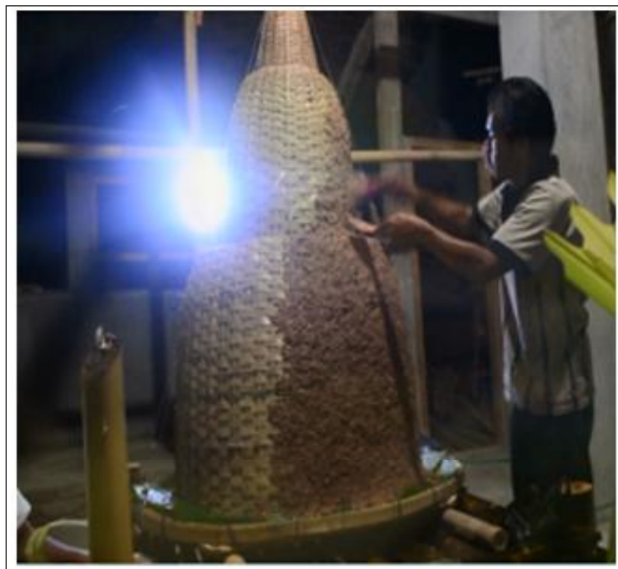
Gambar 2. Membuat Buceng Agung