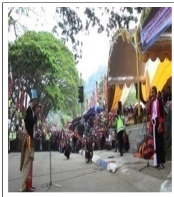
Gambar 8. Serah Terima Sesaji

Kirab dilaksanakan setelah serah terima sesaji selesai. Semua paraga dan sesaji larungan dibawa masuk kedalam mobil pick up yang sudah disediakan oleh panitia. Setelah semuanya siap dilanjutkan kirab keliling telaga. Tujuan kirab untuk memperingati tahun baru 1 Sura, selain itu supaya para masyarakat dapat melihat wujud sesaji larungan , yaitu buceng agung dan buceng buah . Setelah kirab selesai semua sesaji dikeluarkan dari mobil. Buceng buah diperebutkan oleh masyarakat sedangkan buceng agung dibawa ke telaga (Gambar 9).