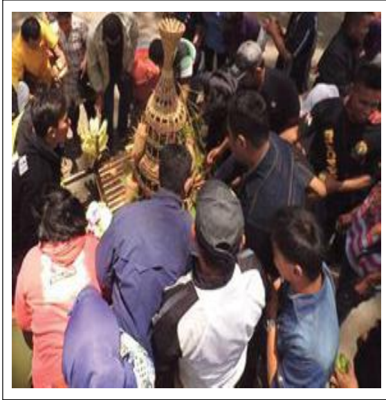
Gambar 9. Warga Memperebutkan Buceng Buah

rakit hingga ke tengah telaga (Gambar 10). Dengan di-larung-nya buceng agung menandai berakhirnya acara larungan .